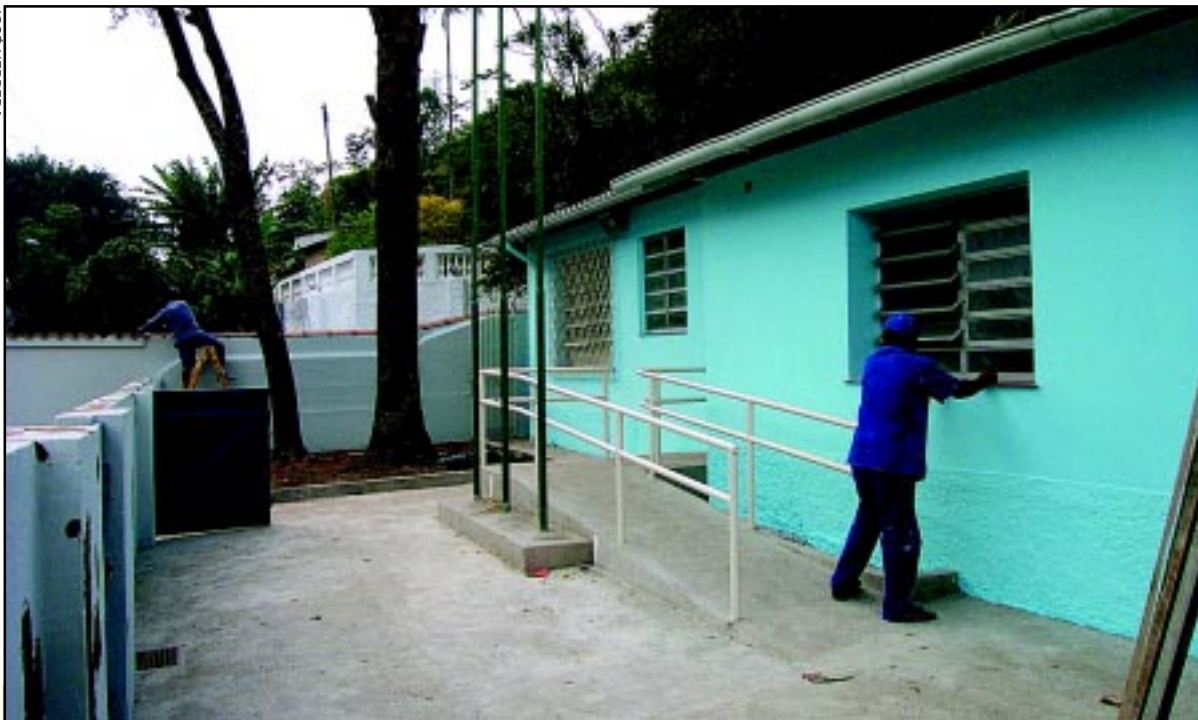
Escola tem rampas para deficientes físicos e banheiro adaptado

maternal; uma área interna coberta para recreio, banheiros e refeitório adaptados, além de instalações para um lactário. O imóvel ganhou