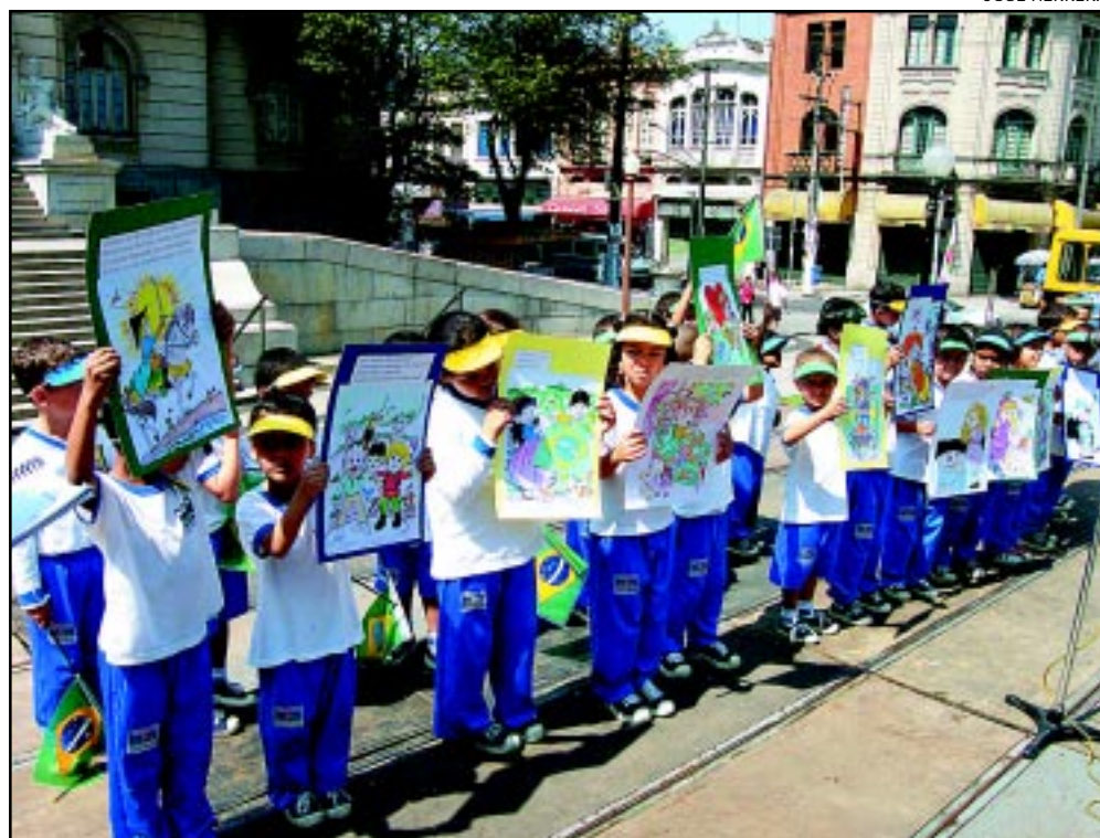
Alunos manifestaram sentimento cívico ontem pela manhã no Centro

Hoje, acontecerá a premiação dos alunos vencedores do