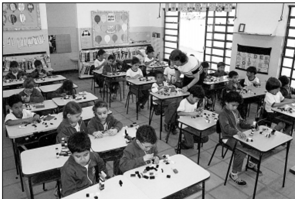
Secretaria de Educação divulgou os procedimentos a serem adotados pelas unidades

Até sexta-feira, os diretores de creches deverão enviar aos diretores das emeis do mes-