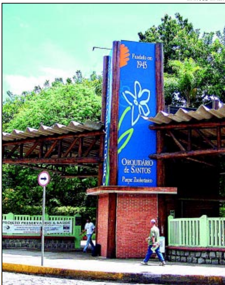
Parque promove ampla programação para comemorar aniversário

A celebração continua para a garotada, dias 20 e 21, com o teatro de fantoches sobre História do Orquidário e oficina de desenho Parque dos Sonhos . A exposição fotográfica Brasilidade - Retratos de Uma Civilização , de autoria do fotógrafo Antonio Vargas, ficará no mostruário de orquídeas até o dia 1, depois cede espaço para a 69ª Exposição Nacional de Orquídeas e retorna no dia 17 e fica até o dia 28.