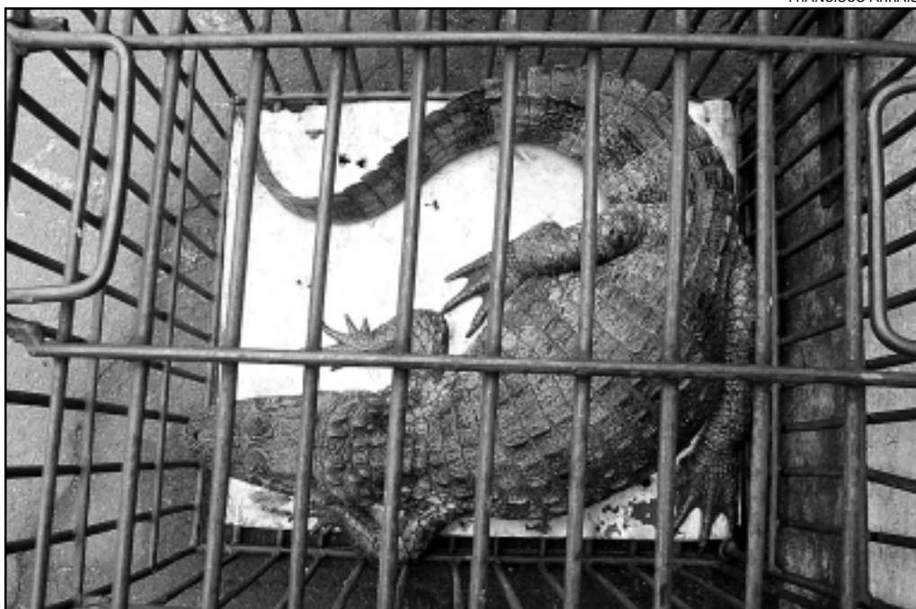
O animal foi levado para a sede do Corpo de Bombeiros, em uma gaiola de ferro