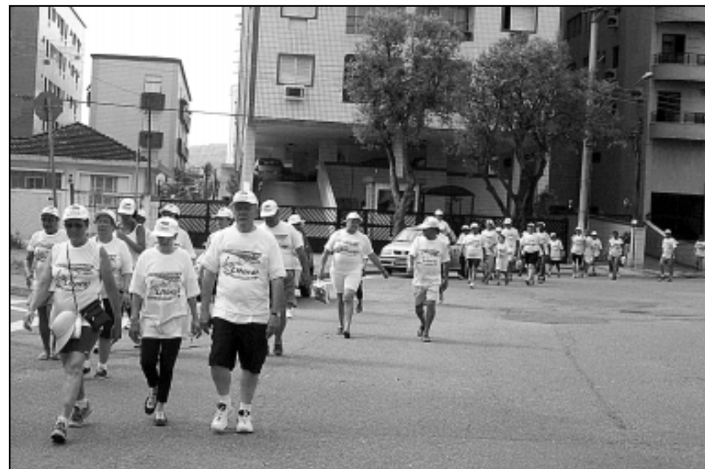
Iniciativa integrou o Programa Agita Santos da SMS

mostra-se às pessoas que, em Santos, é possível levar uma vida ativa fisicamente sem gastar dinheiro. Santos é um lugar que proporciona isso aos habitantes.