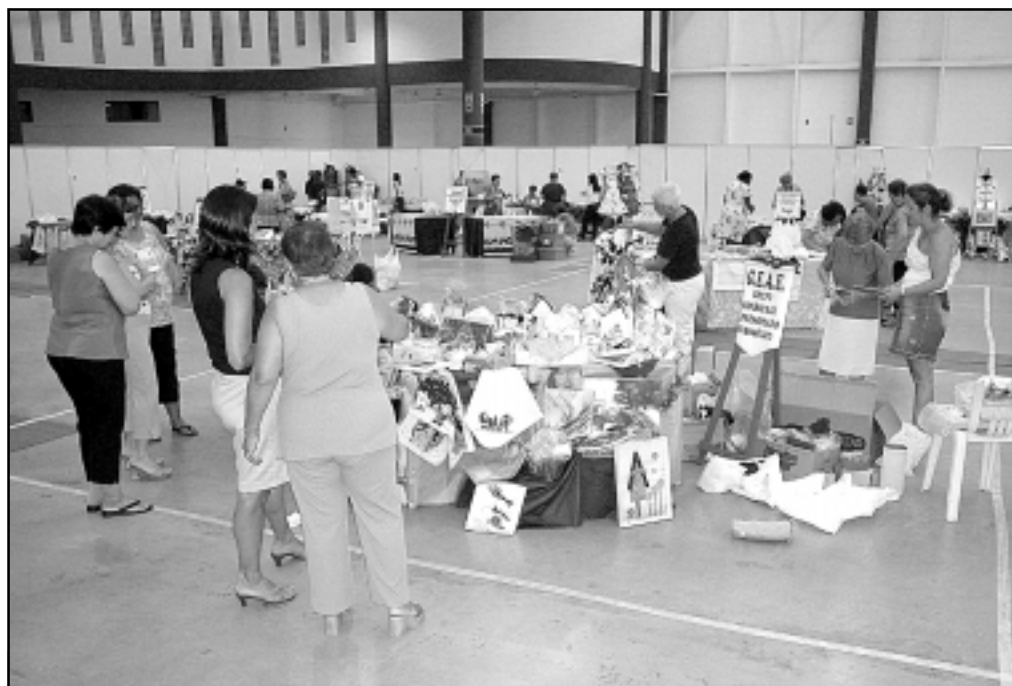
Ontem à tarde, voluntários montavam os estandes para o evento que começa hoje

Na tarde de ontem, voluntários das entidades montavam os estandes com muito entu-