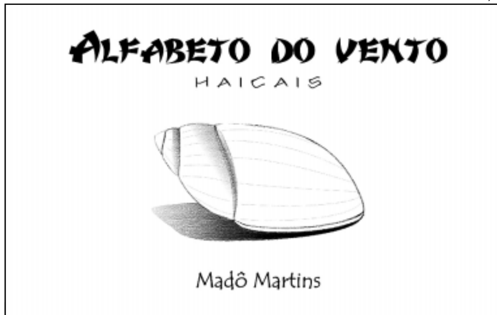
Este é o quinto livro a ser lançado pela autora

Para o lançamento da obra, a autora contou com o apoio do Museu do Café e da Floricultura Gardênia