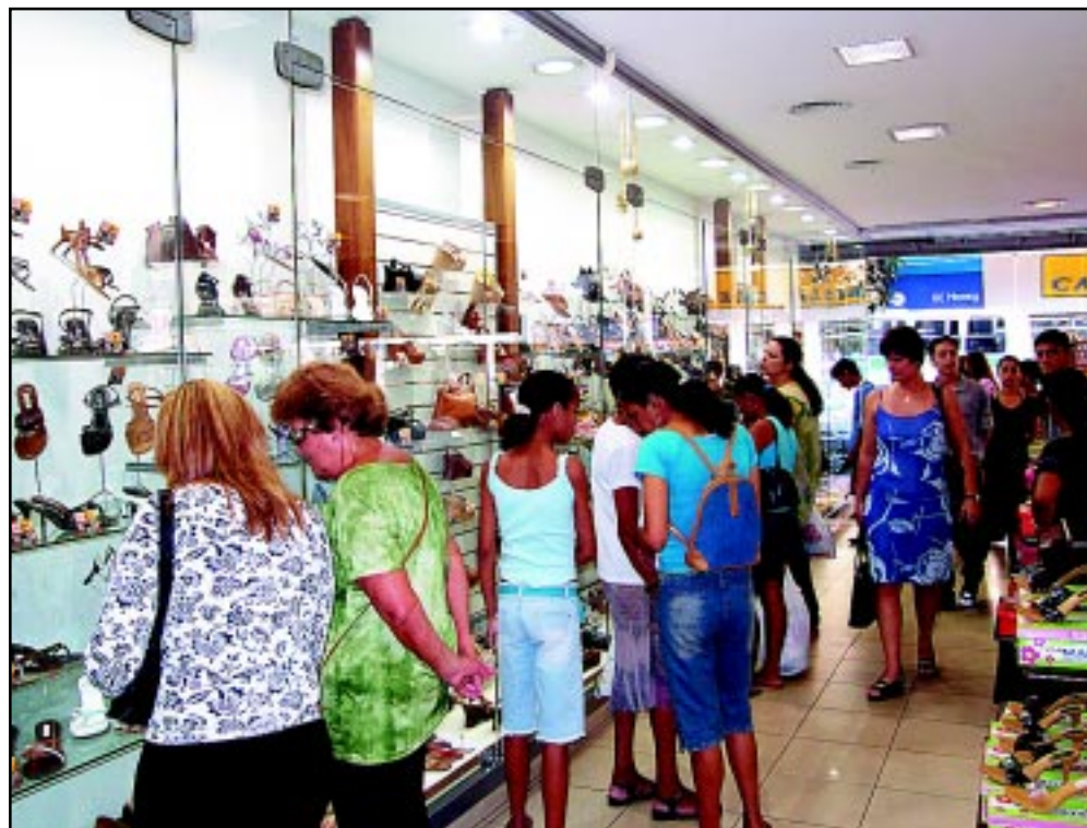
Vitrine comercial é uma das categorias concorrentes do concurso

Para ganhar os prêmios, os concorrentes terão que abusar da criatividade e principalmente da originalidade, que serão avaliados por uma comissão formada por representantes do Fundo Social de Solidariedade, Câmara Municipal, Secretaria de Cultura, jornal A Tribuna e Associação dos Engenheiros e Arquitetos de Santos entre os dias 14 e 6 de janeiro. De acordo com a Setur, a divulgação