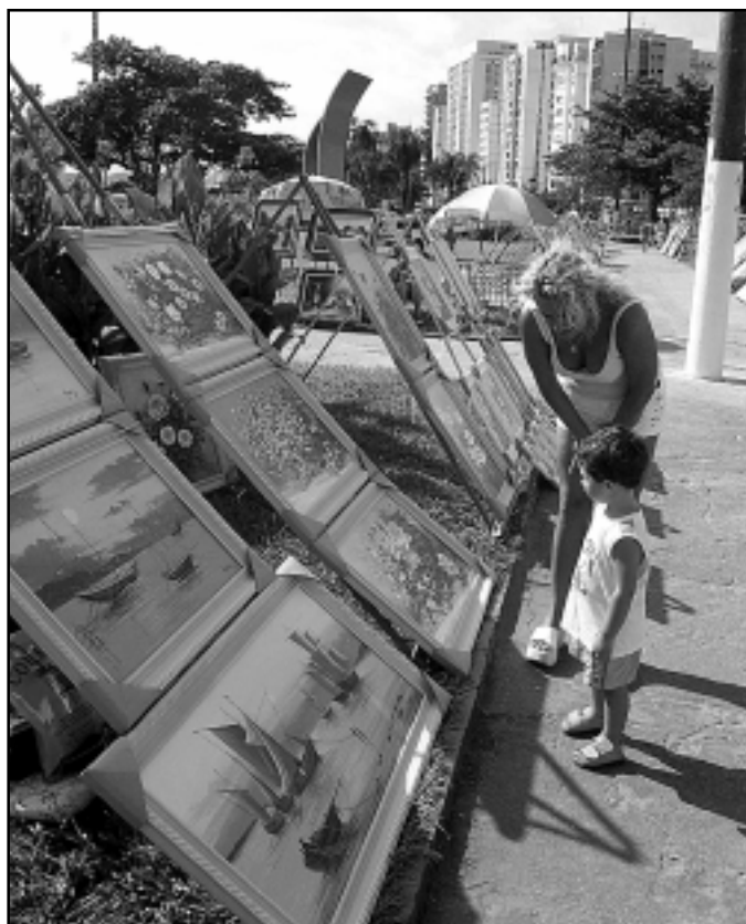
Jardim das Artes fica instalado em frente ao Aquário

ciona nos finais de semana, das 9 às 20 horas. Já a FeirArte pode ser visitada aos sábados, das 14 às 23 horas, no Boqueirão, e aos domingos, das 14 às 22 horas, em frente ao Sesc. No Jardim Botânico é montada das 13 às 19 horas.