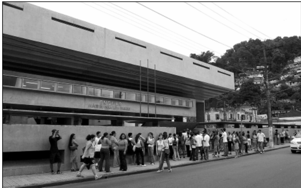
Emefep Acácio de Paula Leite Sampaio fica na Rua Sete de Setembro

O aluno será classificado ao acertar 50% das questões de múltipla escolha, mais um ponto, totalizando 16 pontos. A ordem de classificação se dará com a somatória dos pontos obtidos na redação. Os alunos aprovados deverão efetivar a matrícula, nos dias 24, 25, 27 e 28 de janeiro de 2005, na secretaria da escola, das 10 às 21 horas.