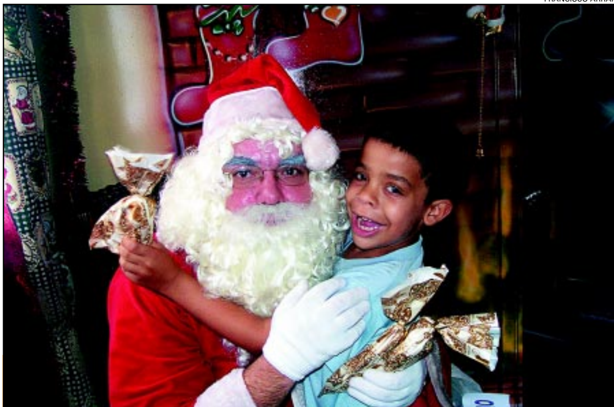
Personagem natalino levou presentes a crianças de escolas, creches e entidades beneficentes