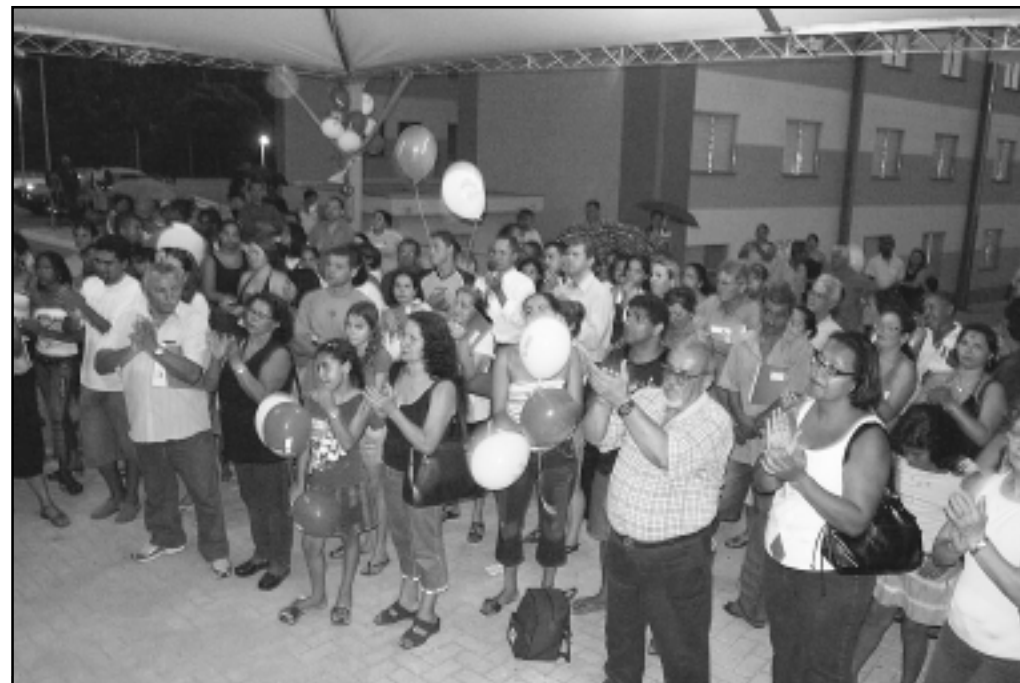
Entrega das chaves aconteceu anteontem à noite no estacionamento do núcleo

Com 51,44 m 2 , cada apartamento tem dois dormitórios, sala, cozinha, banheiro e área de serviço. O condomínio é