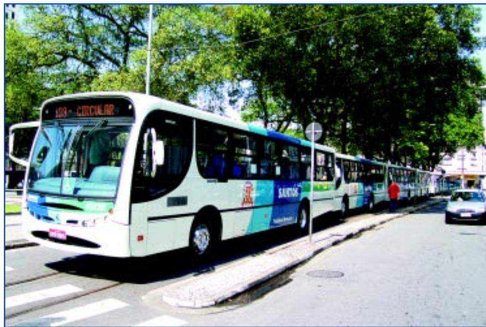
Veículos foram entregues ontem pela manhã na Praça Mauá

As linhas que receberão os novos ônibus serão definidas em conjunto com o Condefi e a Coordenadoria de Defesa de Políticas para Pessoas Portadoras de Deficiência, já que existe um mapeamento dos usuários e dos locais por onde eles mais se locomovem pela Cidade.