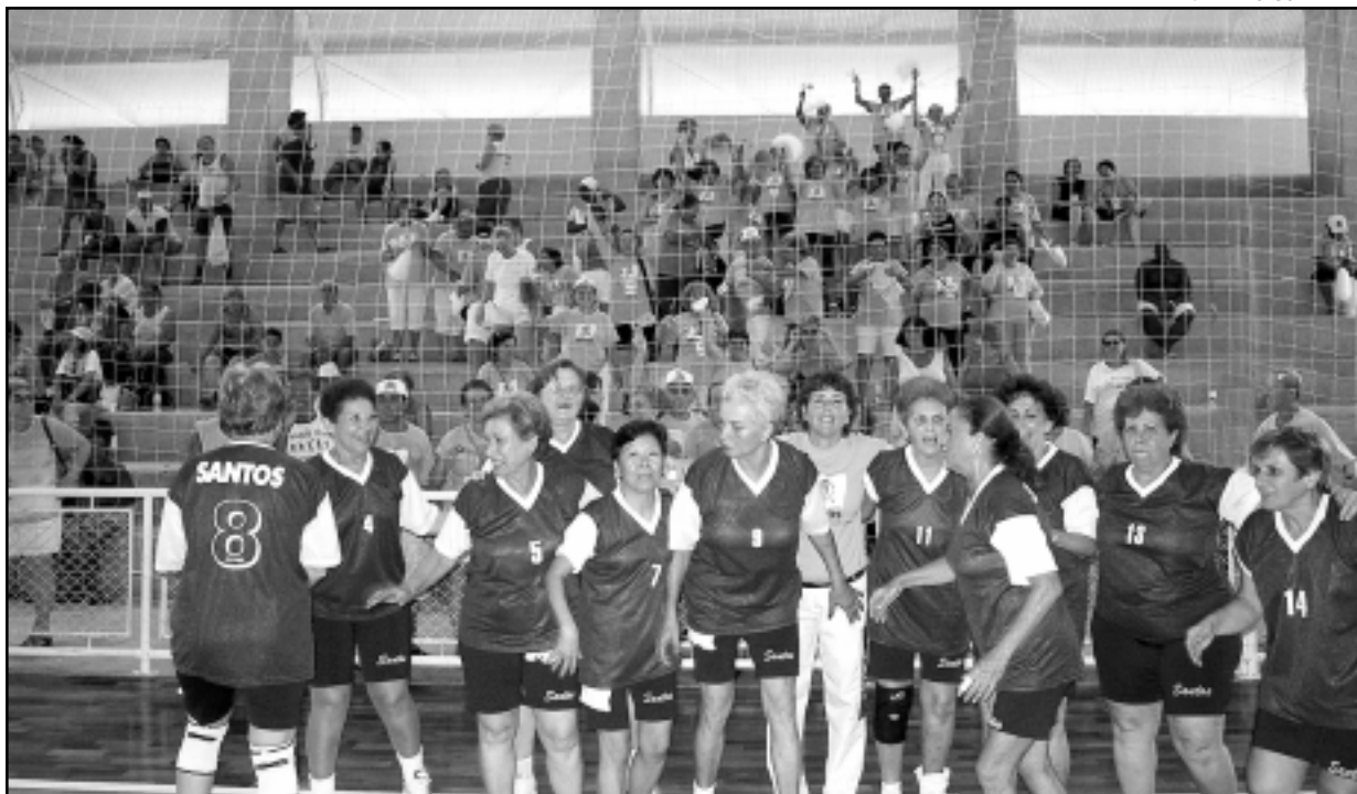
Equipe de vôlei feminino comemora a vitória contra Franca por dois sets a zero, no ginásio Rodrigo

A cerimônia de abertura oficial do evento acontece hoje, com a presença da primeira-dama do Estado, Maria Lúcia Alckmin, a partir das 16h30, no Centro