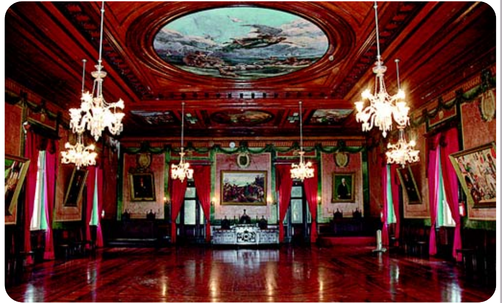
Ambiente é dedicado ao cultivo das tradições portuguesas, como a pintura no teto que retrata Os Lusíadas

No salão 'Cerejeira' fica a galeria de fotos dos ex-presidentes da entidade e são realizadas reuniões do Conselho Deliberativo. O Centro também conta com biblioteca, formada por acervo de 1.500 livros, aberta ao público das 9h às 12h e das 14h às 17h. As tradições folclóricas estão preservadas com o Rancho Verde Gaio, existente desde 1962. Seus 45 integrantes se apresentam em diversas cidades do estado de São Paulo e nas festas populares tradicionais realizadas no salão anexo, como as 'Festa do Morango', 'Festa da Cereja', 'Festa da Castanha' e o 'Festival de Folclore'. Quem tiver interesse em participar do rancho deve entrar em contato