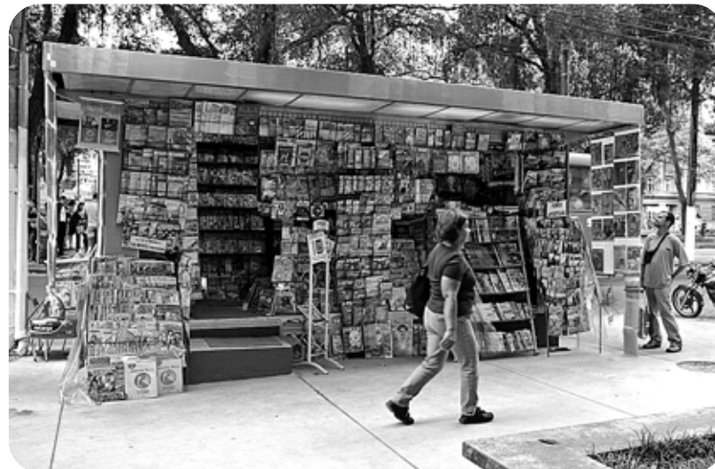
Em Santos, 347 bancas cadastradas apostam na estreita relação com os clientes

Os jornalheiros, que ontem comemoraram seu dia, realizam importante trabalho de levar informação à população, por meio de comercialização de mídia