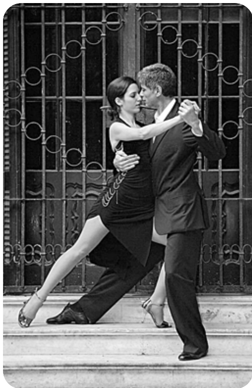
Viaje al Sentimiento será apresentado amanhã, às 21h

Os ingressos, de R$ 40,00 a R$ 80,00, estão à venda na bilheteria do teatro, das 14h às 19h, ou pelo telefone 4062-0016. Informações: 3226-8000.