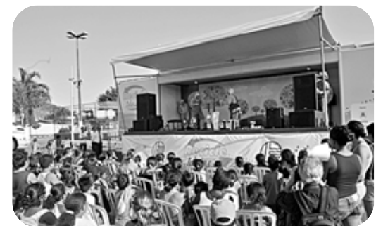
Apresentação teatral propõe redução de consumo

O projeto 'Recicle Ideias', que estimula a conscientização ambiental, atraiu centenas de crianças, sábado à