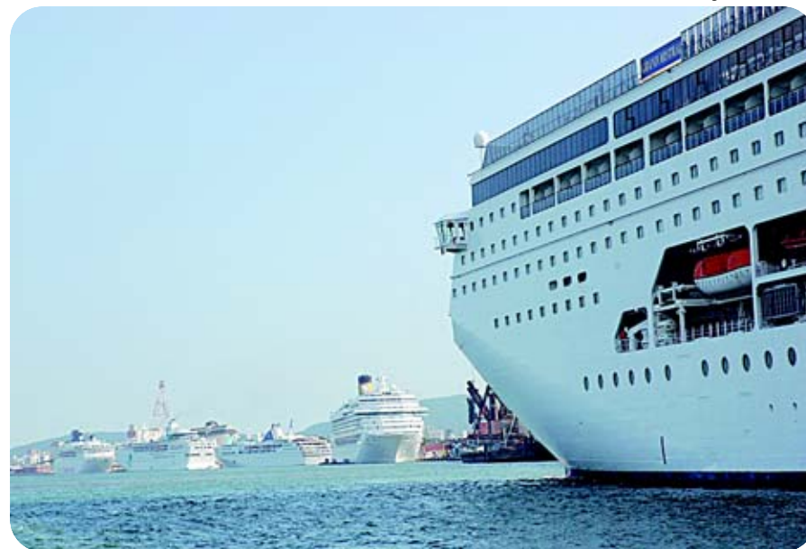
Período encerrado na terça-feira registrou atracação de 16 transatlânticos e 224 escalas

A temporada 2009/2010, com início marcado para 23 de outubro, deverá atender mais de 800 mil passageiros, com a expectativa de atracação de 12 navios, em 215 escalas.