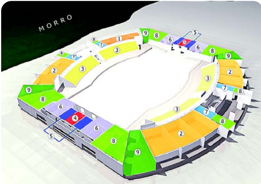
Térreo: 1- refeitório/serviços, 2- ginástica/musculação, 3- depósitos, 4- apoio médico, 5-vestiários (árbitros), 6- vestiários (equipes), 7- sanitários, 8- escadas e elevadores e 9- acessos