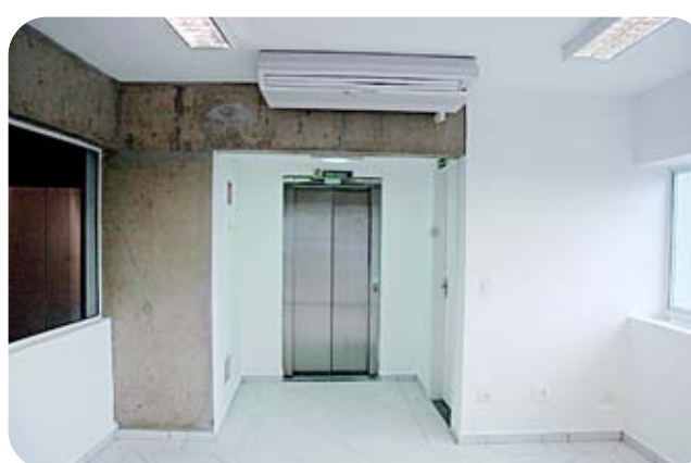
Estrutura conta com elevadores e ambientes climatizados