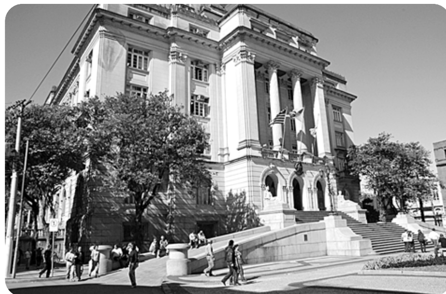
Medidas incluem pagamento dos servidores em data única e concurso interno na Guarda Municipal

Atendendo à antiga reivindicação dos monitores de creche, a categoria será enquadrada no Magistério como educador de desenvolvimento infantil, com base em lei federal que classifica as categorias da Educação. O projeto de lei complementar sobre a mudança será encaminhado à Câmara Municipal nos próximos dias. Se aprovado, os monitores terão acréscimo salarial de