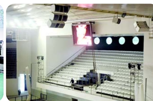
Quadra é dotada de telão, sistemas de som e iluminação