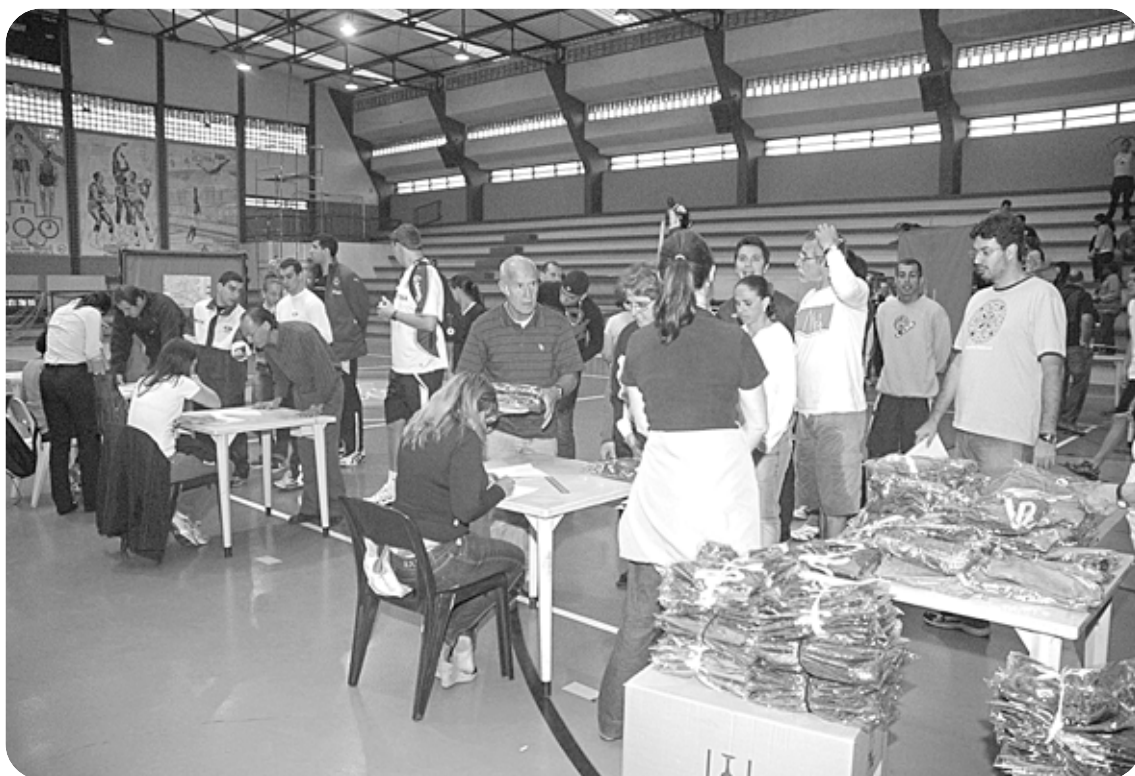
Integrantes da Fupes entregam uniformes daqueles que conduzirão hoje o fogo simbólico por 32 km na cidade

O fogo olímpico segue conduzido pela Av. Francisco Ferreira Canto, Caminho São Jorge, Av. Prefeito José Gomes (subida do morro), Rua Manoel Pereira, avenidas Antônio Manoel de Carvalho, Moura Ribeiro, Pinheiro Machado, Presidente Wilson e Ana Costa, ruas Almeida de Moraes, Joaquim Távora e Princesa Isabel, onde fica o estádio Urbano Caldeira (Vila Belmiro). De lá, a tocha será carregada até a Av. Rangel Pestana, 184, na Vila Mathias, onde fica a Arena Santos. Os Jogos Abertos são realizados conjuntamente pela Prefeitura de Santos e governo do Estado, com patrocínio da Caixa Econômica Federal e apoio da Sabesp e CPFL Energia.