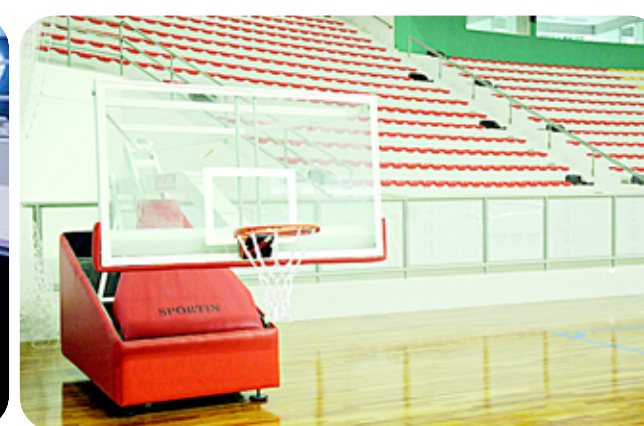
Quadra poliesportiva tem piso reforçado para amortecer impactos