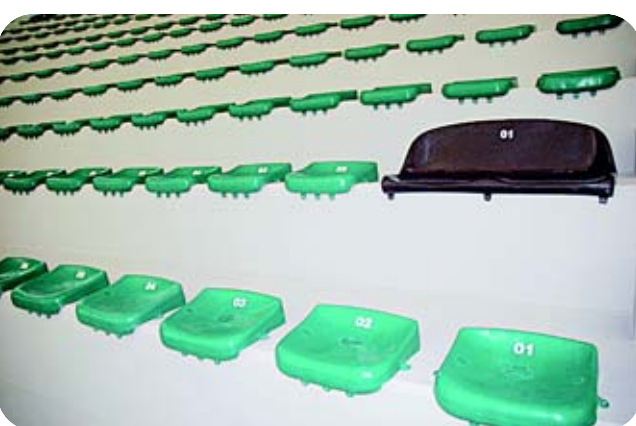
Pessoas com mobilidade reduzida têm reservado assento especial

R$ 17,8 milhões em investimentos (recursos do Governo do Estado e da prefeitura) 11 mil metros quadrados de área construída 200 trabalhadores da construção civil 1 ano e 8 meses de obras