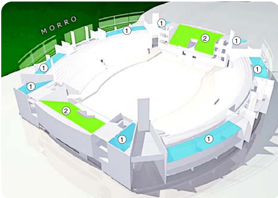
2º andar: 1- área técnica e 2- arquibancadas