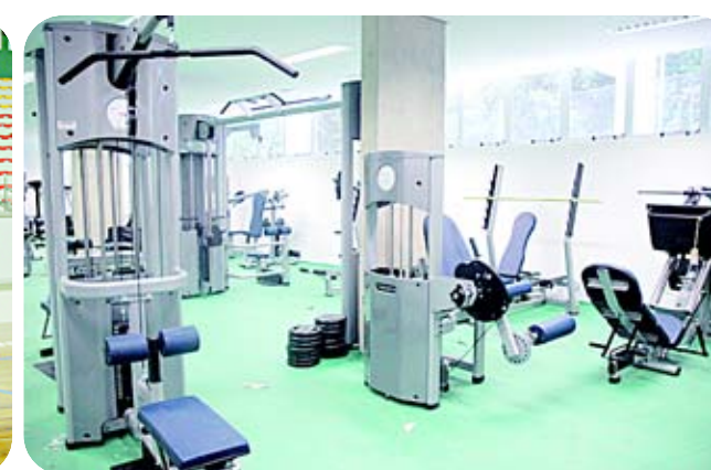
Modernos equipamentos para exercícios ocupam salas de musculação