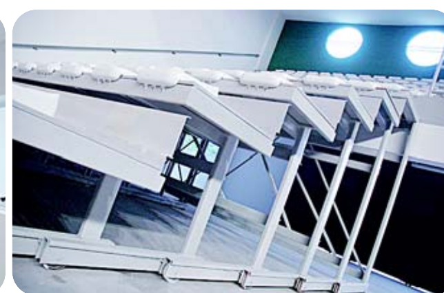
Arquibancadas retráteis abrem espaço para palcos de shows e peças