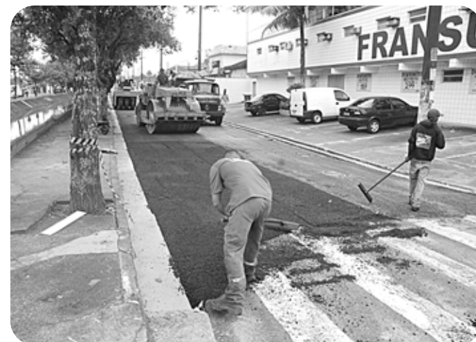
Trabalhadores aplicam camada de asfalto na pista São Vicente-Santos

A obra é antiga reivindicação dos moradores. Segundo eles, o desnível da rua colocava em risco os motoris-