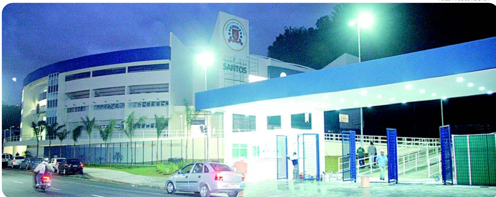
Fachada da arena na Vila Mathias e ginásio poliesportivo, com a pira olímpica em primeiro plano