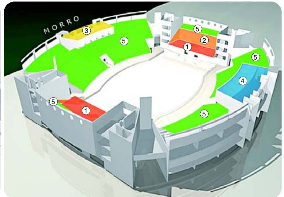
3º andar: 1- palco, 2- arquibancadas móveis, 3- imprensa, 4- camarotes e arquibancadas fixas