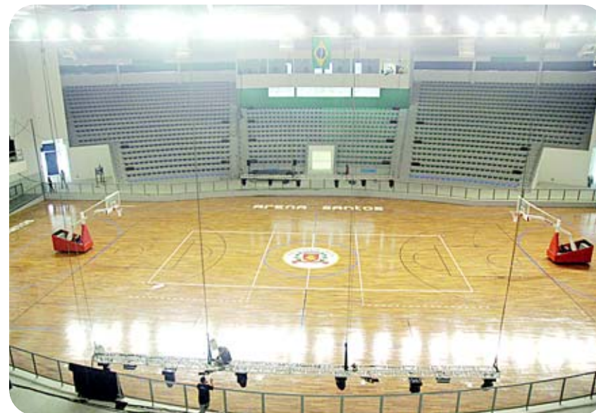
Moderna construção na Vila Mathias ocupa antigo terreno da CPFL (abaixo) adquirido pela administração municipal