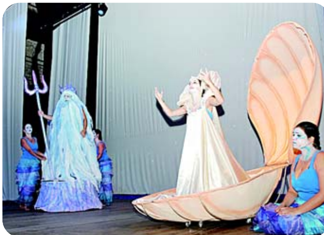
Cena da peça O Remédio do Rei