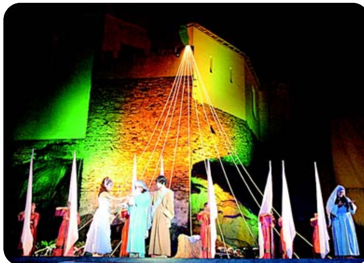
Espectáculo será apresentado pela segunda vez no marco de fundação da cidade