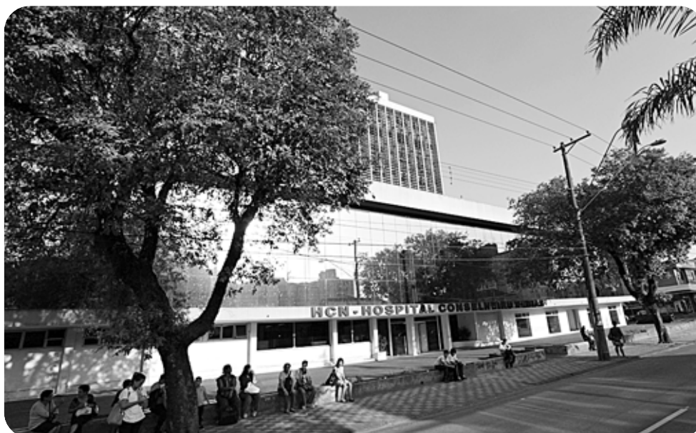
Antigo Hospital dos Estivadores (acima) contará com 73 leitos, sendo 27 de UTI neonatal, e será integrado à Rede Cegonha; Complexo Hospitalar da Zona Noroeste (abaixo) manterá atendimento às gestantes