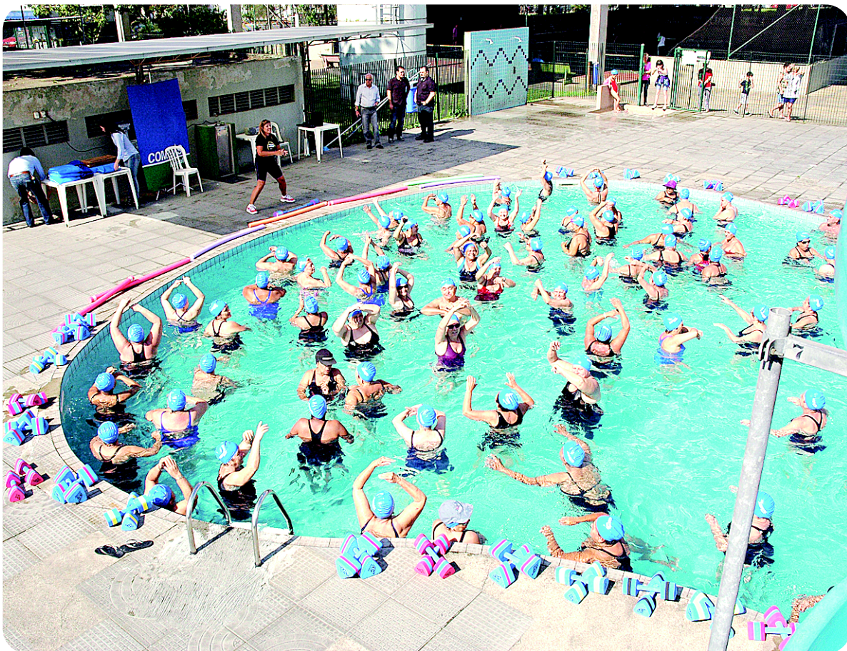
Cerca de 800 alunos de natação e hidroginástica participam de gincana no Complexo Esportivo Rebouças

Santistas vão em busca de medalhas nos Jogos Abertos do Interior