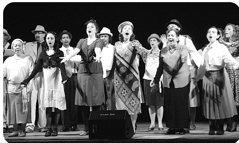
Banda Vetor (acima) se apresenta no Guarany, hoje, às 19h; no mesmo local, grupo Bel Canto se exhibe amanhã