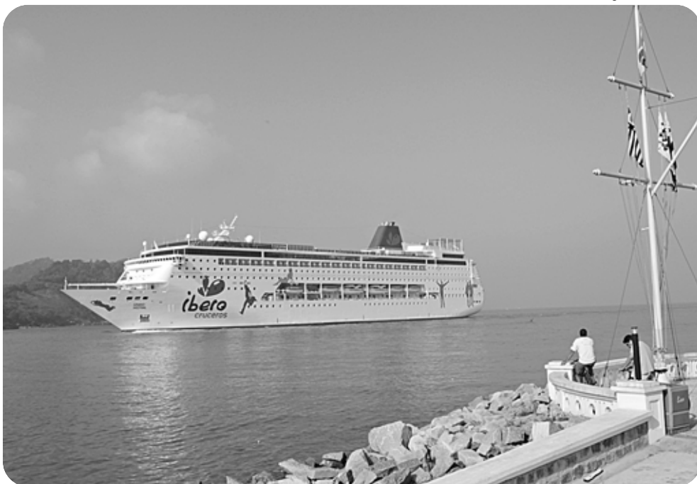
Agências querem ampliar oferta de atrações turísticas para passageiros de navios em trânsito na cidade