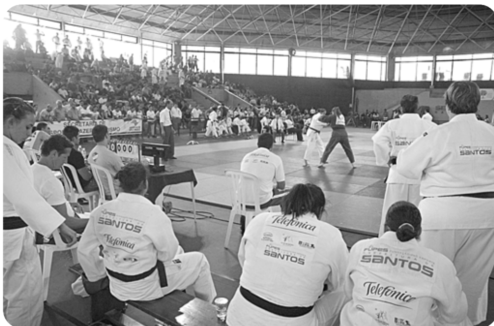
Cidade será representada na competição por 49 equipes; judô e tênis de mesa têm chances de garantir medalhas

volvimento e divulgação entre os participantes, e não contam pontos para a classificação. A promoção é da Secretaria de Estado de Esporte, Lazer e Juventude. Outras informações no site www.jogos-abertos2011.com.br