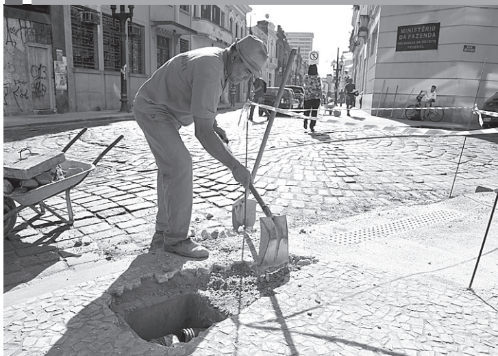
Peças brancas em mosaico são recolocadas na rua do Comércio

A recuperação das calçadas do Centro Histórico segue na rua Cidade de Toledo, entre a Frei Gaspar e a praça Mauá; e na praça Rui Barbosa, trecho da r. General Câmara à João Pessoa, com colocação dos novos pisos de mosaico português. As obras consistem na substituição do atual passeio por concreto desem-