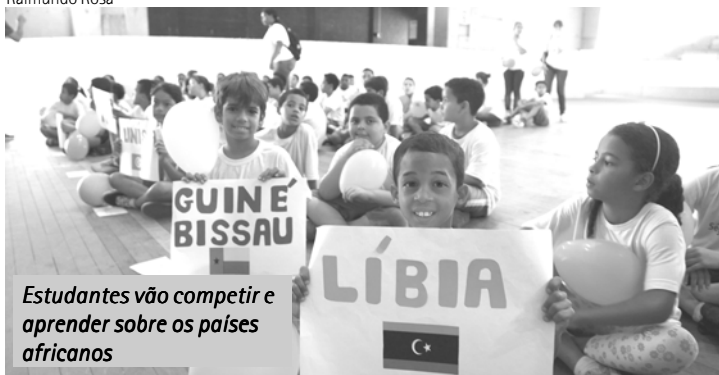
Estudantes vão competir e aprender sobre os países africanos