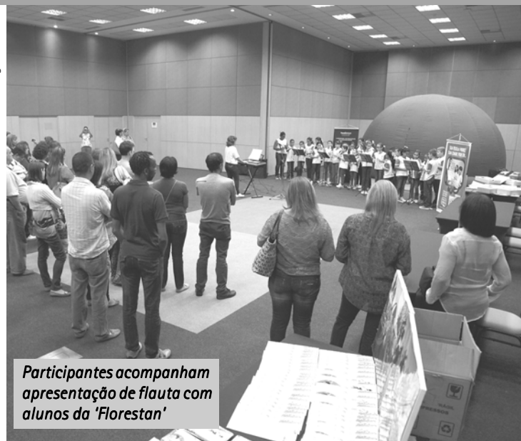
Participantes acompanham apresentação de flauta com alunos da 'Florestan'