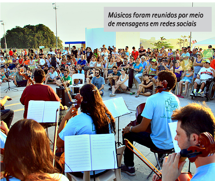
Músicos foram reunidos por meio de mensagens em redes sociais