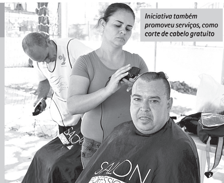
Iniciativa também promoveu serviços, como corte de cabelo gratuito

o Bairro’ com uma série de serviços. “Cortei o cabelo e fiz maquiagem. Tudo de graça. O programa é bom e divertido”. O ‘Cidade Cidadã’ teve ainda serviços de orientações do Centro Público de Emprego, Banco do Povo, expedições de documentos pelo Poupatempo, medição da pressão arterial, orientações de higiene bucal e dengue, além de música e atividades de lazer.