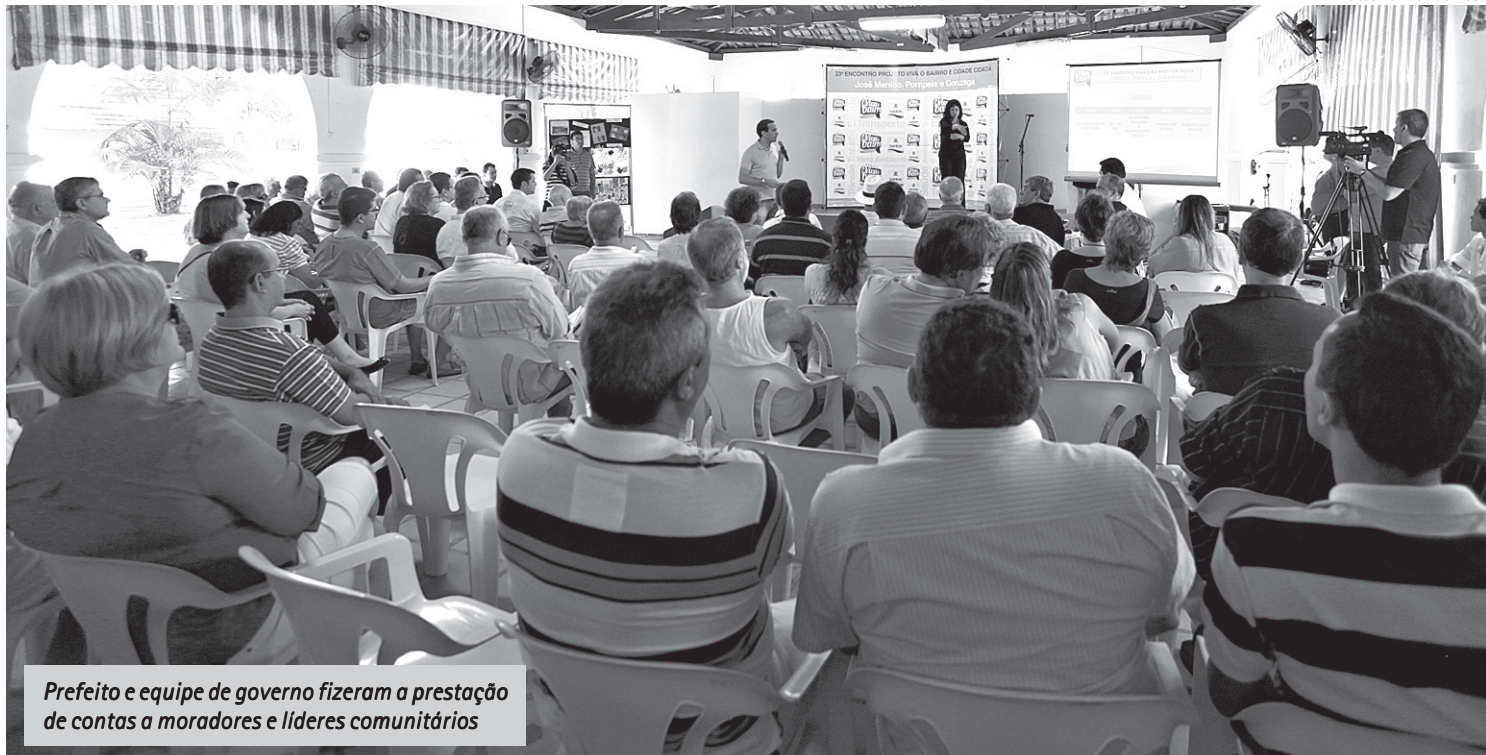
Prefeito e equipe de governo fizeram a prestação de contas a moradores e líderes comunitários

A prefeitura realizará nos próximos meses uma série de melhorias no Gonzaga, Pompeia e José Menino. Os investimentos somam cerca de R$ 15 milhões. O conjunto de obras foi anunciado sábado pelo prefeito Paulo Alexandre Barbosa, durante o 23º encontro do projeto Viva o Bairro na escola Leonor Mendes de Barros.