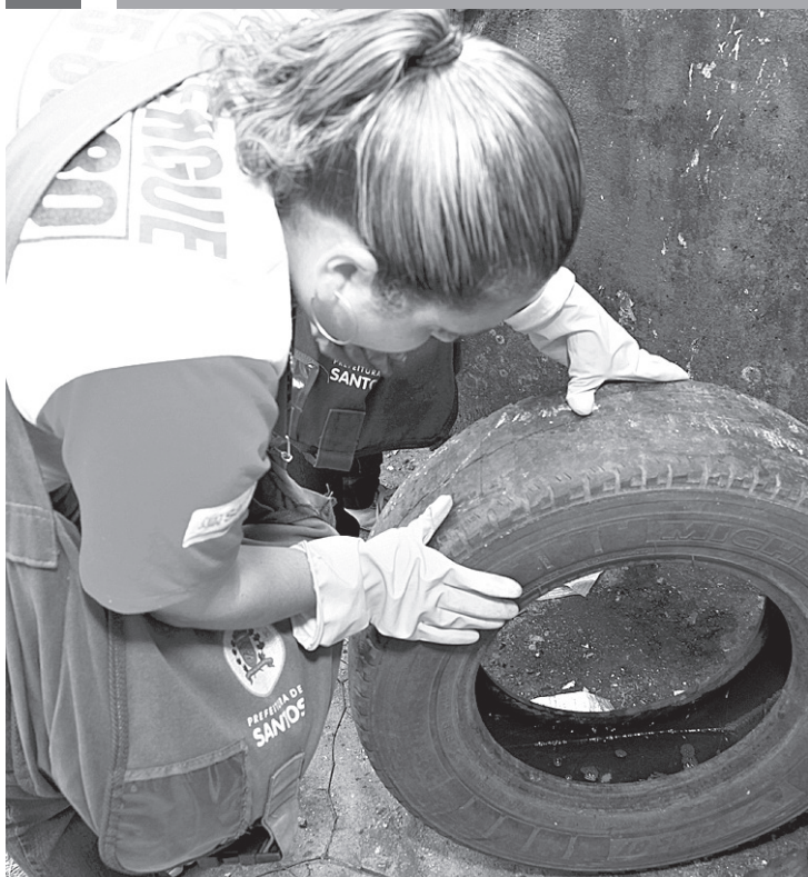
Agentes vistoriam áreas dos imóveis para localizar possíveis criadouros