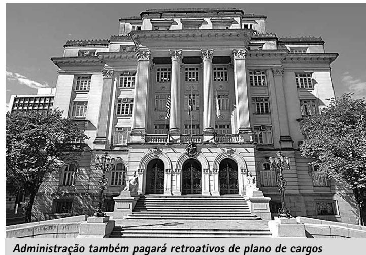
Administração também pagará retroativos de plano de cargos

Também no dia 20 será feito o pagamento da progressão funcional do PCCV (Plano de Cargos, Carreiras e Vencimentos), retroativo de abril a outubro, para 3.749 servidores. O efetivo de 35% do quadro já recebeu o primeiro pagamento da progressão no salário de novembro – a relação dos beneficiados foi publicada na edição do dia 13. Em média, o aumento corresponde a 3% do valor de vencimento do cargo. Somente os retroativos correspondem ao acréscimo de R$ 1,8 milhão na folha salarial.