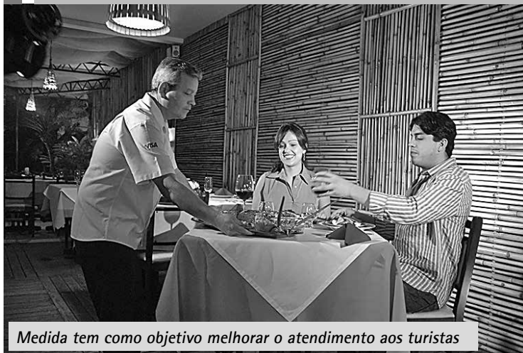
Medida tem como objetivo melhorar o atendimento aos turistas

Os estabelecimentos prestadores de serviços turísticos da cidade terão prazo de 60 dias para disponibilizar um livro de reclamações em local de fácil acesso aos consumidores, conforme lei federal. A decisão foi acertada anteontem em reunião promovida pelo Cidoc (Centro de Informação, Defesa e Orientação ao Consumidor), com representantes do Sin-