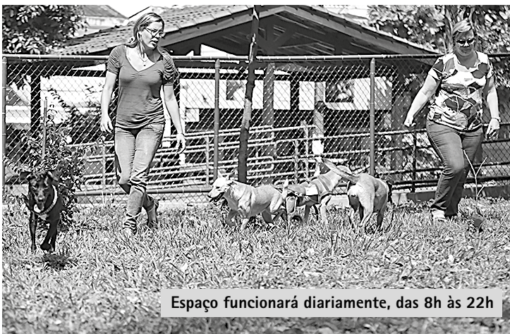
Espaço funcionará diariamente, das 8h às 22h

A prefeitura entrega amanhã, às 18h30, a Praça dos Cães, na Aparecida (em frente ao Sesc). O espaço (teve a inauguração transferida no último sábado por conta as chuvas) tem dois mil m 2 de área arborizada e é cercado para permitir a livre circulação