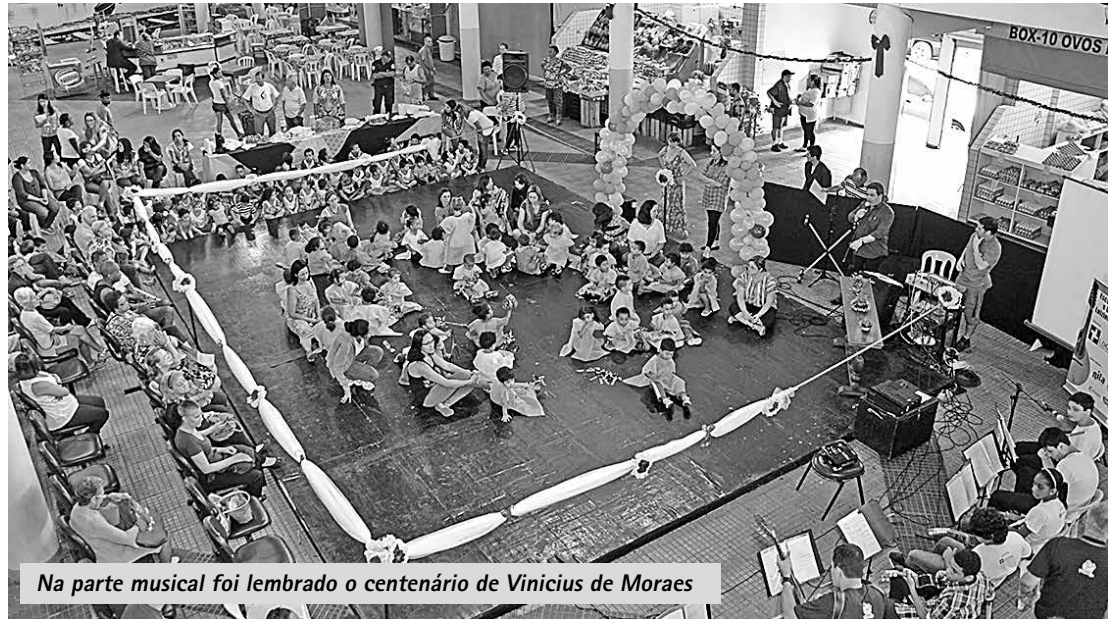
Na parte musical foi lembrado o centenário de Vinicius de Moraes

As recentes melhorias no espaço, como pintura interna, reforma de portas, iluminação e estacionamento regulamentado, foram destacadas pelo coordenador do