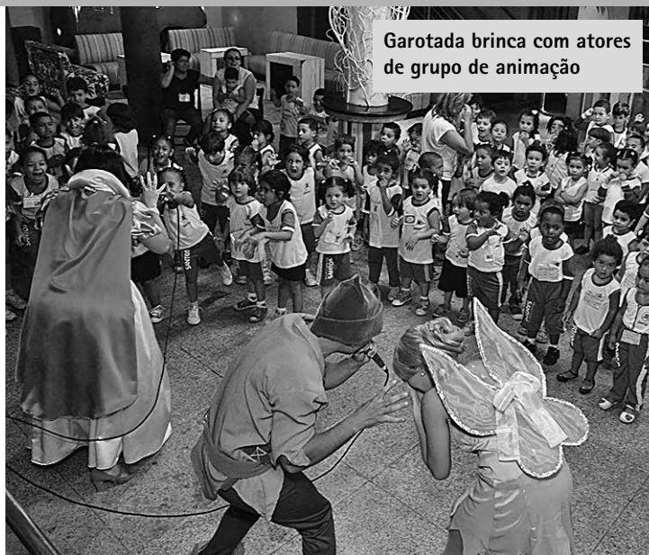
Garotada brinca com atores de grupo de animação

O FSS inscreve somente amanhã instituições para ocupar o Bazar da Solidariedade. Interessados devem comparecer na avenida Conselheiro Nébias, 388, das 9h às 12h e das 14h às 17h.