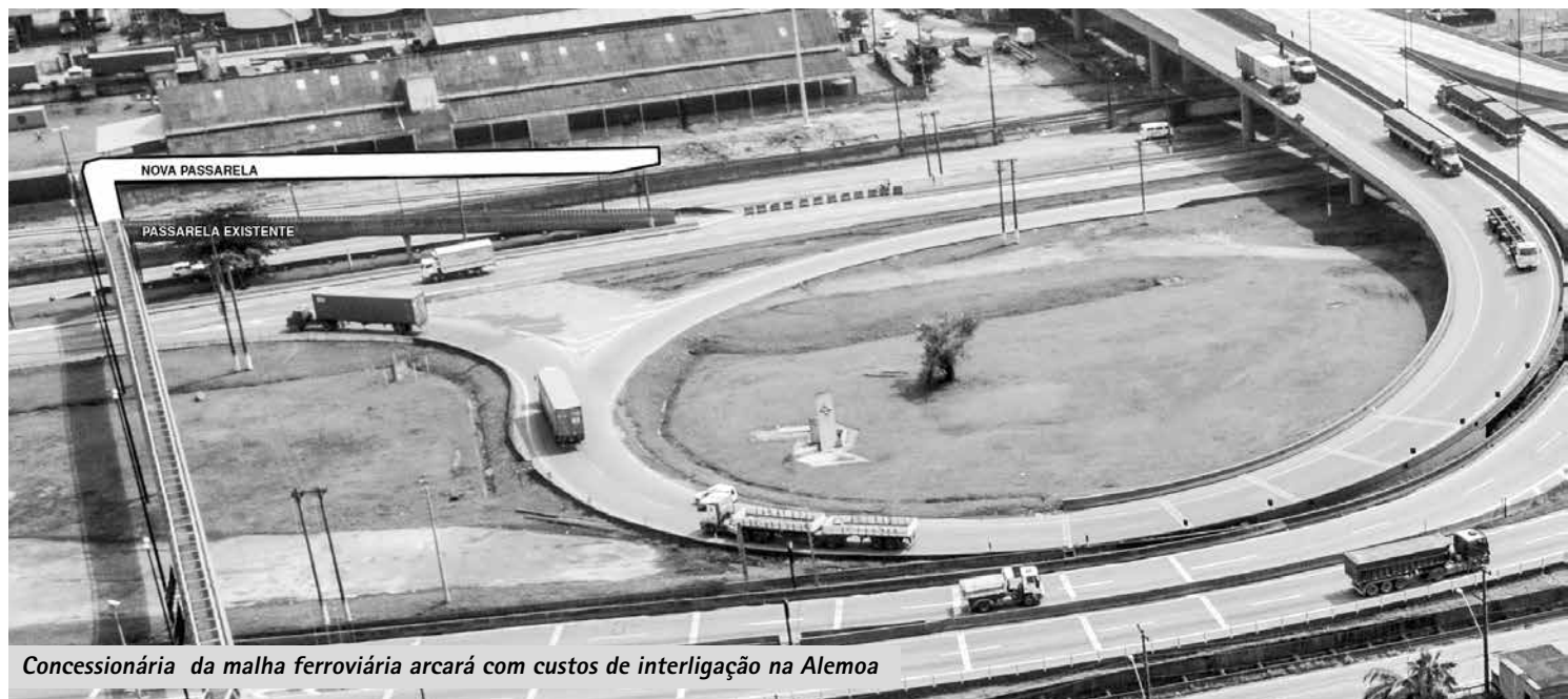
Concessionária da malha ferroviária arcará com custos de interligação na Alemoa

As intervenções no Saboó prevêem o aprofundamento do rio Lenheiros e instalação de uma estação elevatória com comporta, dentro das intervenções para o fim das enchentes do programa Santos Novos Tempos. “Esta parceria vai permitir modificações numa etapa muito importante