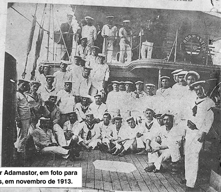
A tripulação do cruzador Adamastor, em foto para a Revista Fita, de Santos, em novembro de 1913.