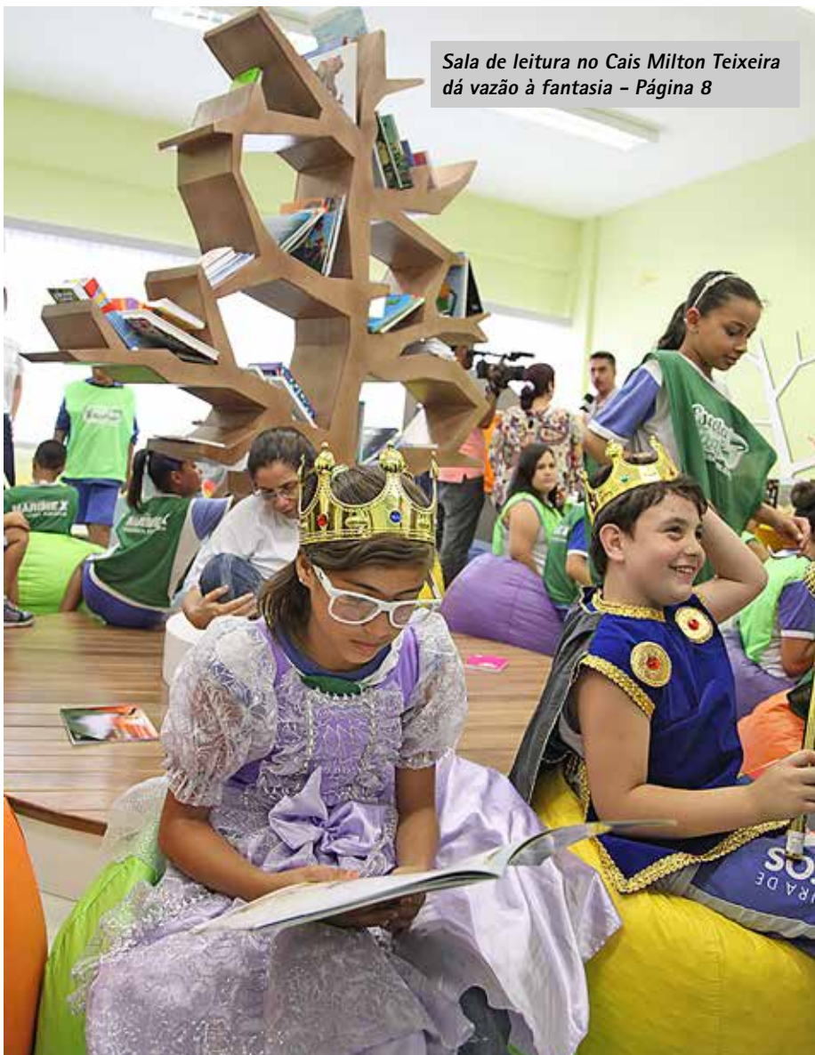
Sala de leitura no Cais Milton Teixeira dá vazão à fantasia - Página 8