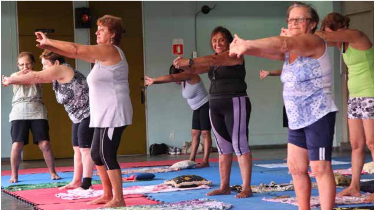
Ontem de manhã, no complexo Rebouças, Ponta da Praia, houve alongamento, musculação e hidroginástica

Com muita disposição, e até sentindo falta dos exercícios, participantes usufruem de diversas modalidades