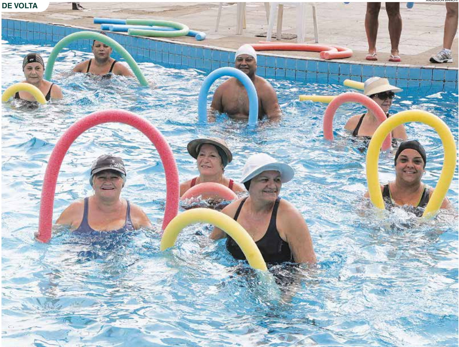
Aulas de hidroginástica e outras modalidades são retomadas nos equipamentos da prefeitura > Página 21