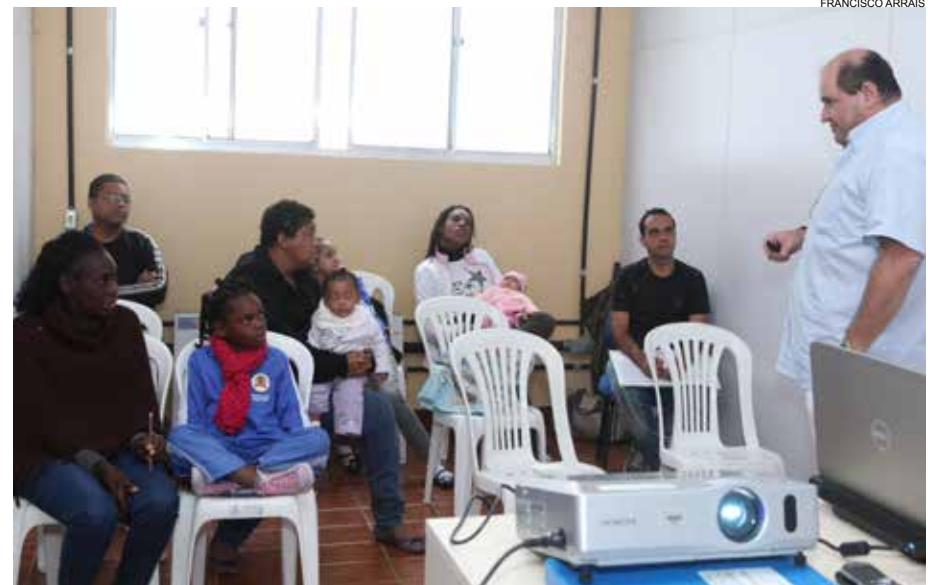
Atividades preparatórias ao atendimento foram realizadas no Centro POP

O cuidado com os moradores de rua será iniciado pela eliminação dos focos infecciosos, como raízes residuais, extração de dentes condenados, tratamento gengival e endodôntico-canal.