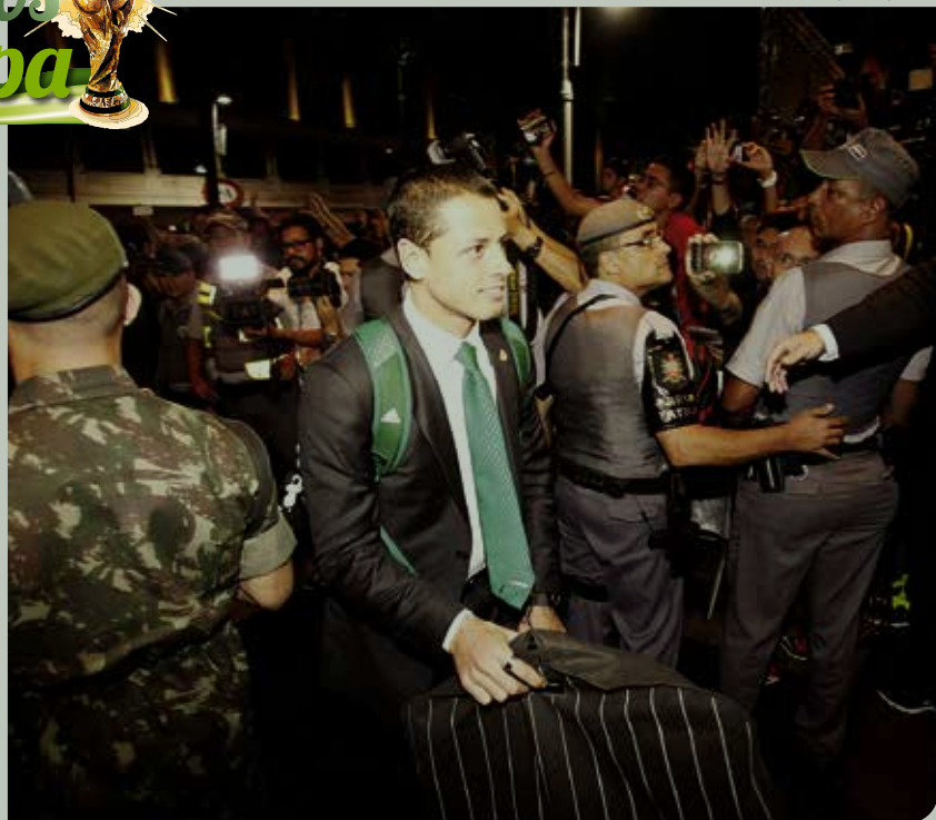
Delegação mexicana é integrada também por chefe de cozinha e nutricionista

Dejep e Desmet (para funcionários públicos) - das 9h às 13h.