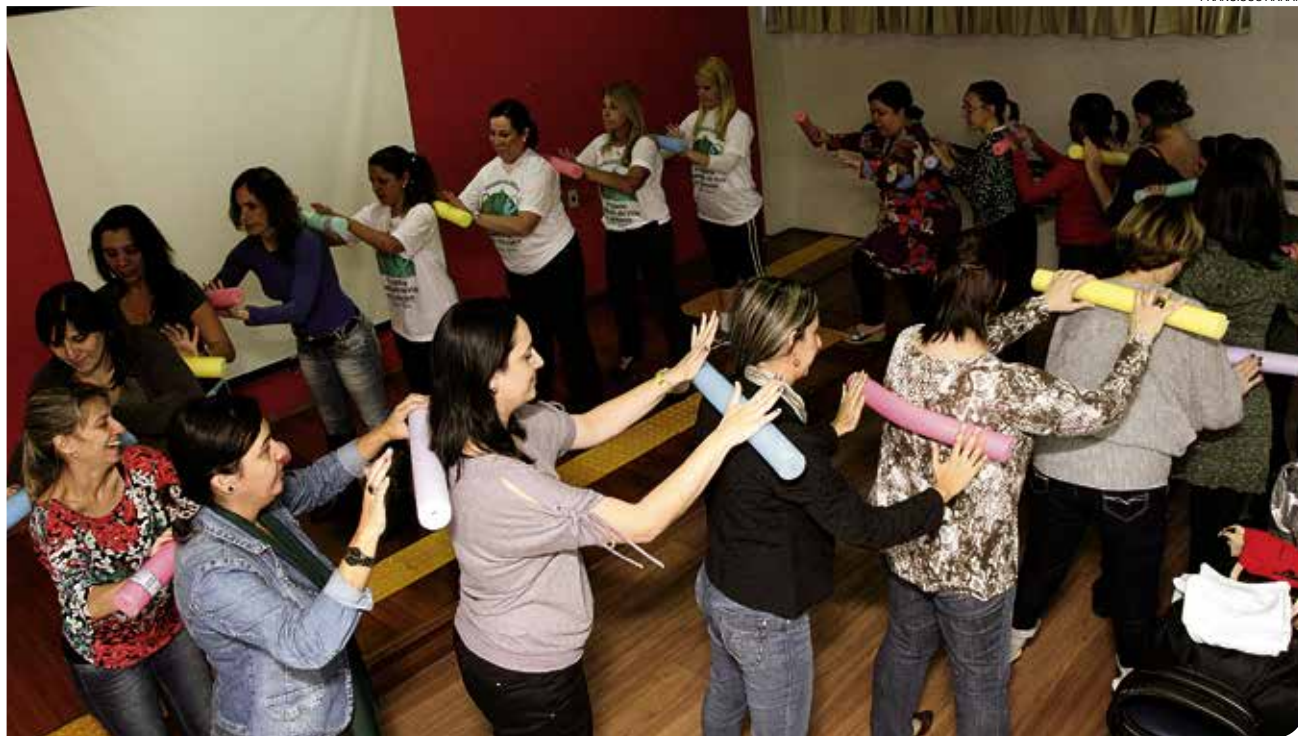
Grupo pratica um dos exercícios do programa de atividades que visa à melhoria da qualidade do educador

Projeto de ginástica laboral é desenvolvido em escolas da rede municipal