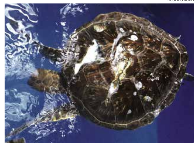
Especie de Chelonia mydas apresenta fratura no casco

tá distribuída por todos os oceanos, com duas populações distintas no Atlântico e Pacífico. O nome deve-se à coloração esverdeada de sua gordura corporal. Por se tratar de uma espécie clas-