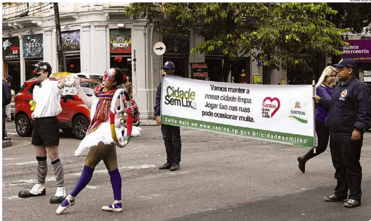
Palhaços seguram sacolas da campanha e fazem cenas diante de faixa para estimular adesão à iniciativa da prefeitura

A etapa educativa da campanha segue até 4 de julho. Ainda faz parte da iniciativa a publicidade em busdoor e placas de rua. A partir de 5 de julho, quem