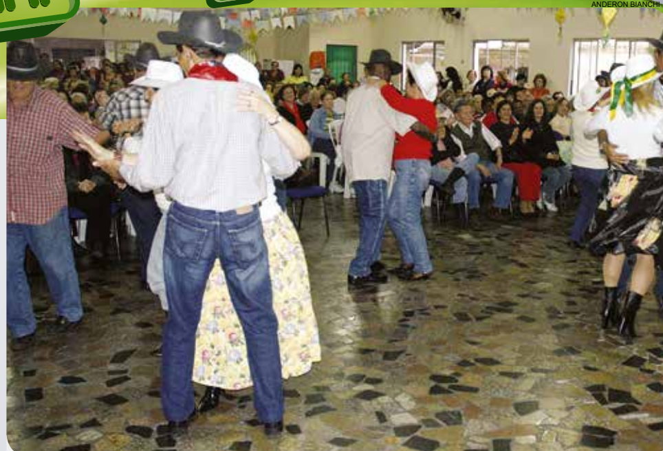
Festas juninas movimentam e levantam recursos para diversas entidades assistenciais

O Desafio Jovem de Santos (Casa de Recuperação de Dependentes Químicos) está precisando de doação de galões de tinta branca e azul, rolos e pincéis e também de leite e açúcar. As doações podem ser entregues na Rua José do Patrocínio, 112, Macuco, em horário comercial, qualquer dia da semana. Telefone 3225-2645.