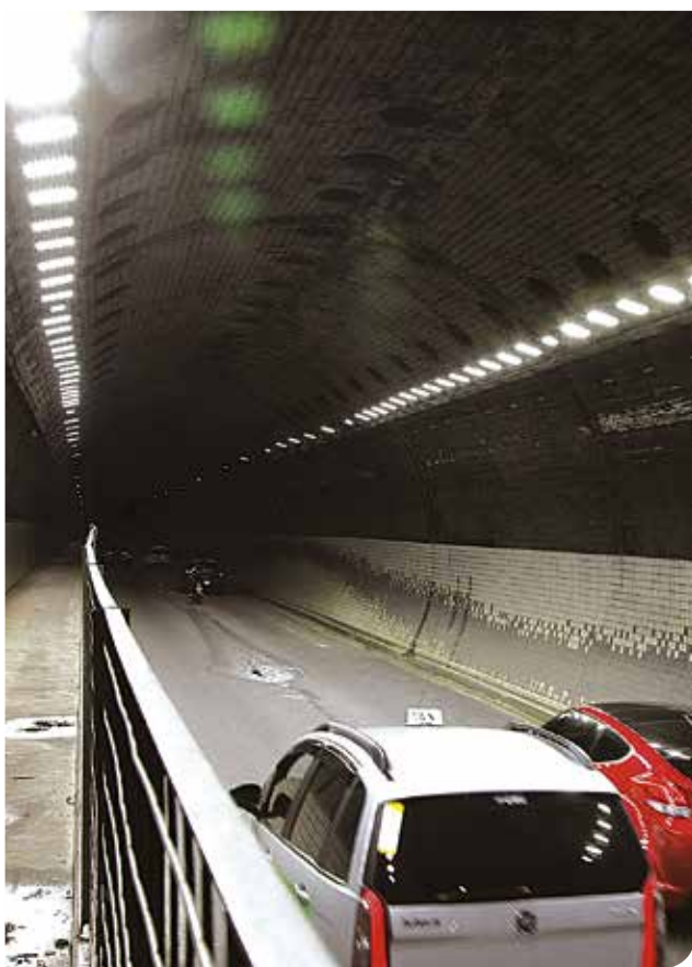
Novas luzes garantem melhor iluminação e mais economia