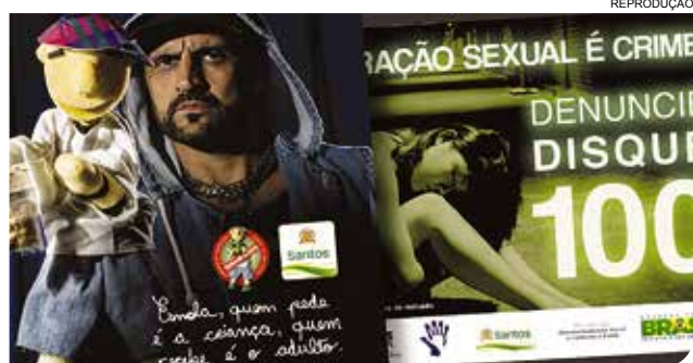
Serão distribuídos 40 mil panfletos e 10 mil adesivos

Em 2013, foram 28 mortes no trânsito; no ano anterior, 54