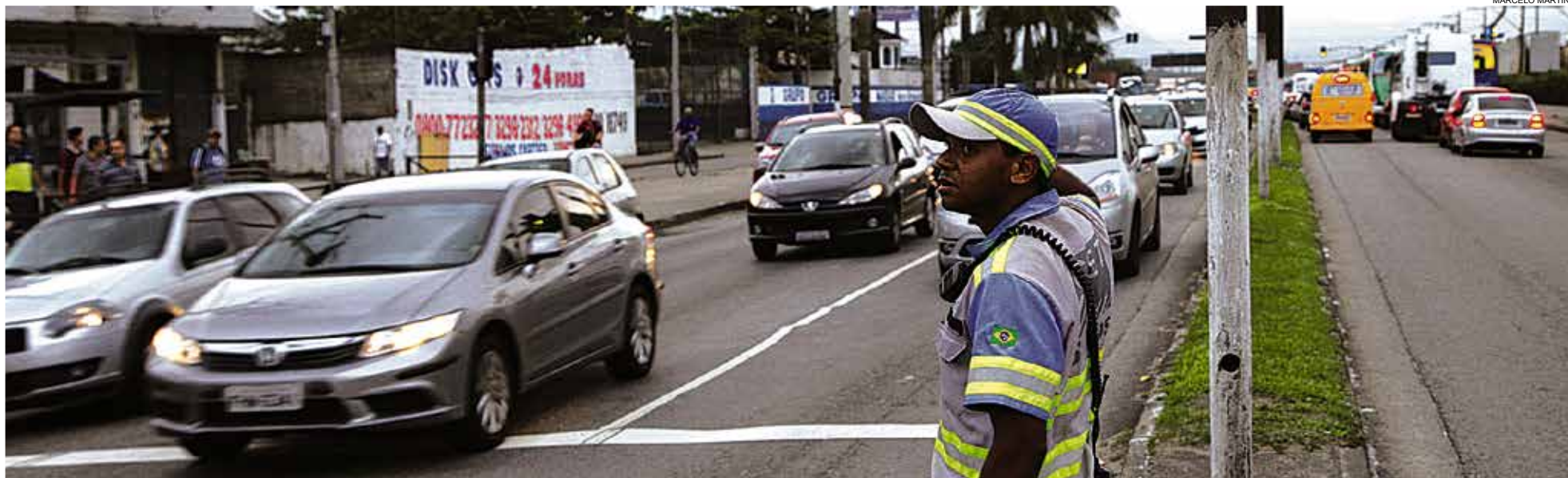
Ampliação do quadro da CET, ações educativas e de fiscalização contribuíram para a queda

Diminuição inclui acidentes fatais com pedestres, ciclistas e motociclistas e segue meta da Organização Mundial de Saúde