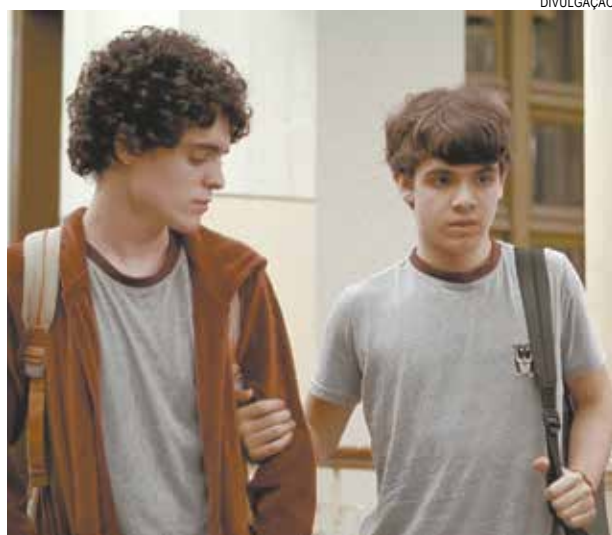
Sábado, tem o brasileiro 'Hoje Eu Quero Voltar Sozinho'

Já no sábado, às 17h, o filme brasileiro Hoje Eu