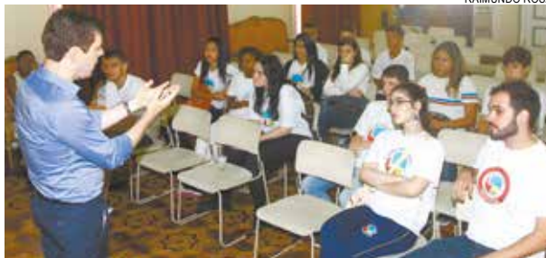
Grupo do Lupe Picasso foi recepcionado pelo Ouvidor

Um grupo de alunos do ensino médio do Instituto Educacional Lupe Picasso, na Vila Belmiro, conheceram o paço municipal na última sexta-feira.