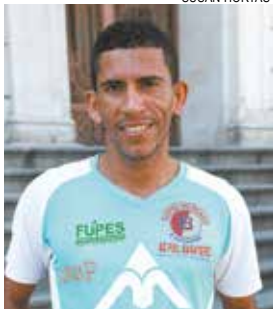
Atleta obteve colocação na categoria quarteto