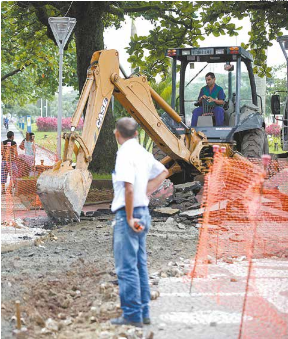
Ciclovia está ganhando piso mais resistente e melhorias no sistema de drenagem

Trabalhos de reurbanização da pista da orla atualmente são realizados entre os canais 2 e 3 e 5 e 6