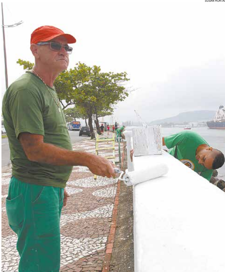
Trabalhos em execução por equipes da Prefeitura incluem pintura das muretas

Outras sete câmeras estão nos postos de salvamento do Corpo de Bombeiros.