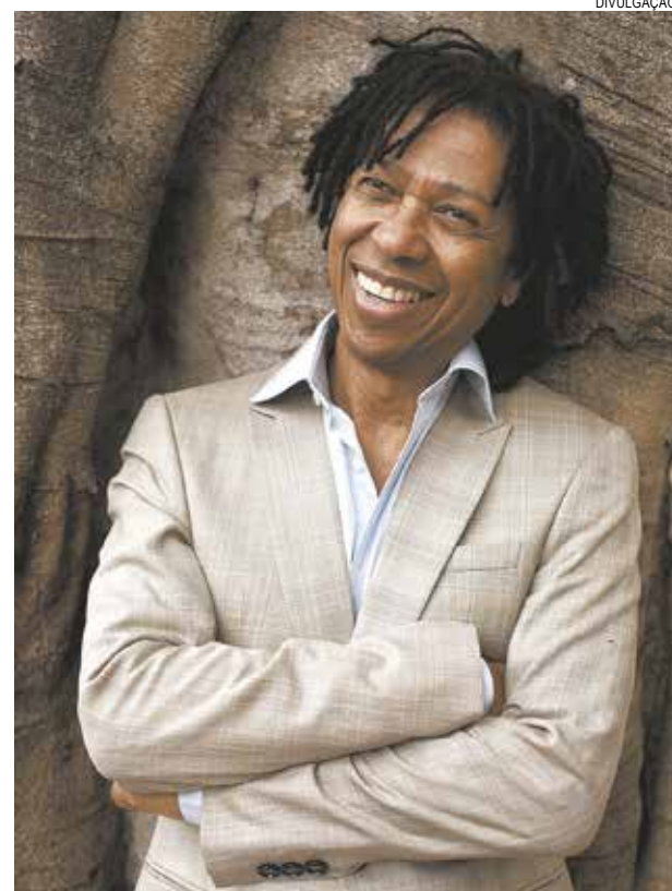
Convidados vão interpretar vários clássicos do cantor

O Viva MPB tem apoio da Prefeitura Municipal de Santos e Churrascaria Tertúlia.