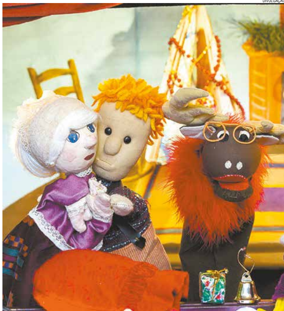
Equipamento receberá no dia 20 a apresentação da Cia. Von Feffer de fantoches

Em caso de chuva, a programação é cancelada. Mais informações pelo telefone 3226-8000 ou no site www.santos.sp.gov.br .