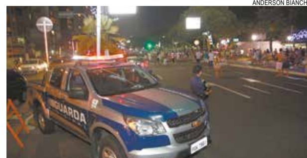
Guardas municipais e policiais compartilharão posto

tá o reforço da iluminação e a disponibilização de câmeras de vídeo para guardas municipais, com o propósito de facilitar a identificação de pessoas que estejam agindo de forma suspeita.