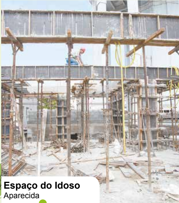
Espaço do Idoso Aparecida