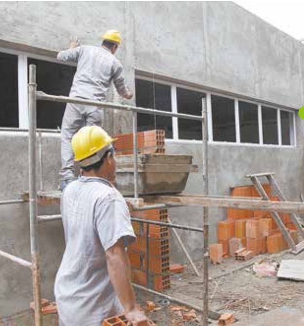
Dimensão da área construída é duas vezes maior que a da antiga unidade

A Prefeitura está construindo um novo edifício para abrigar a Policlínica da Ponta da Praia, na Praça 1º de Maio, com o dobro de área construída da antiga unidade: 635 metros quadrados. Inserida no PROSaúde, Programa de Reformas e Obras Novas, para ampliação da capacidade de atendimento da rede, a obra atingiu 80% dos serviços programados.