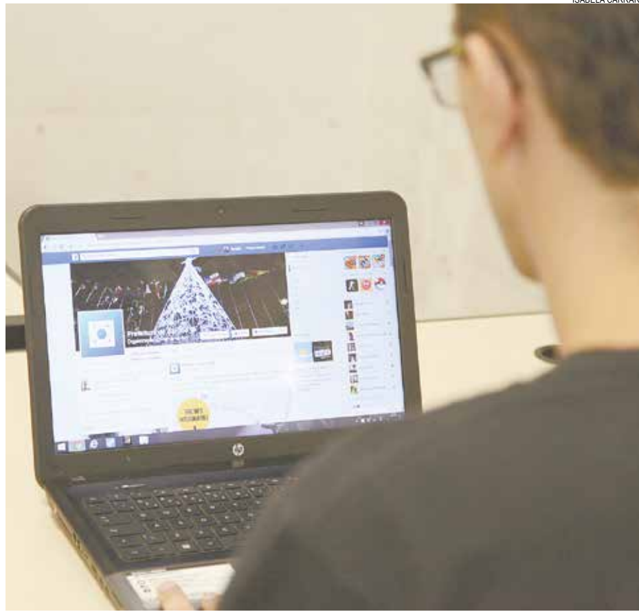
Canal permite que a população registre suas solicitações, elogios e queixas