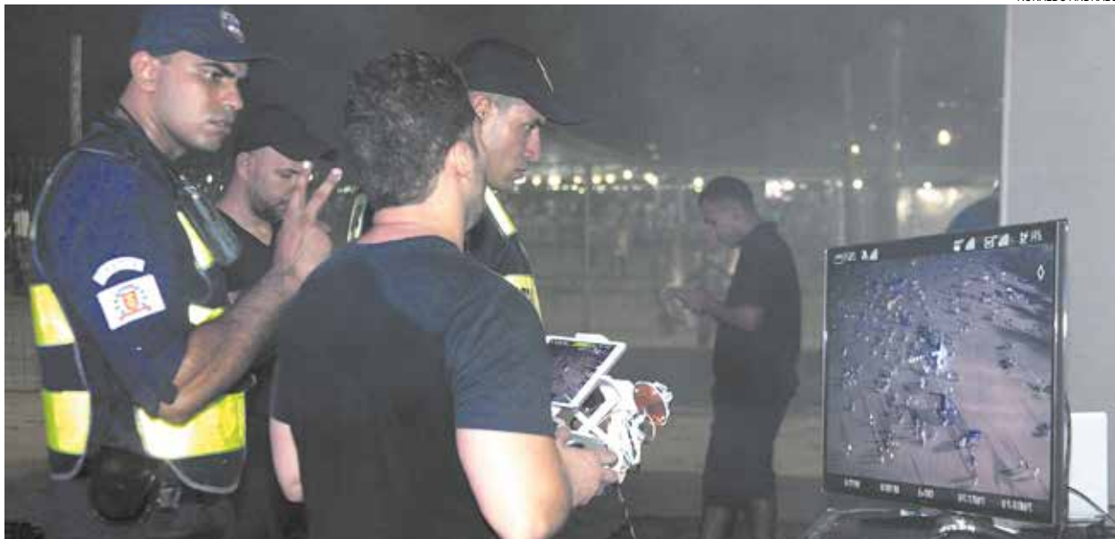
Trabalho integrado de policiais e guardas teve apoio das câmeras, drones e outros recursos tecnológicos

Esquema de segurança foi planejado há três meses