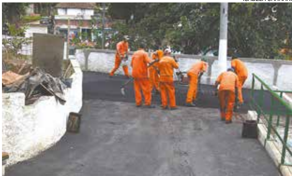
Intervenções incluem drenagem e pavimentação