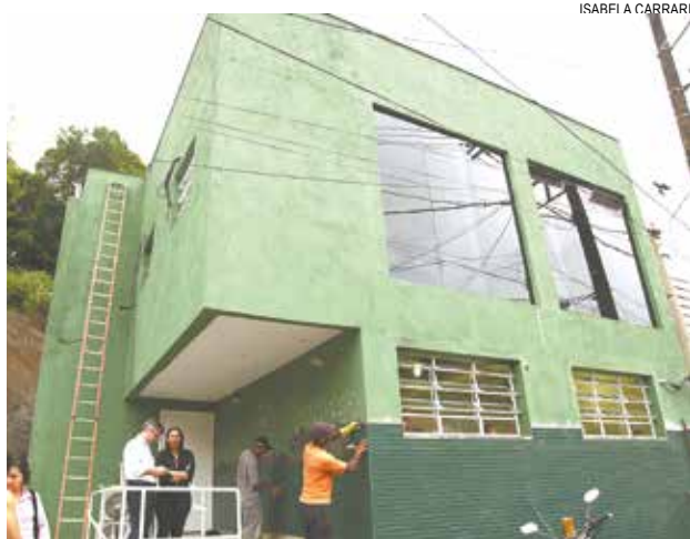
ISARFI A CARRARI