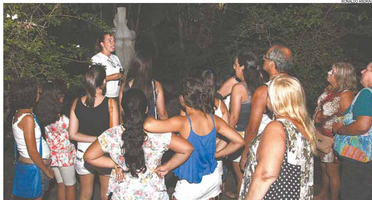
Parque terá, ainda, programação especial para adultos e crianças, com visitas noturnas monitoradas pelos técnicos

Taxa é uma lata ou pacote de leite em pó