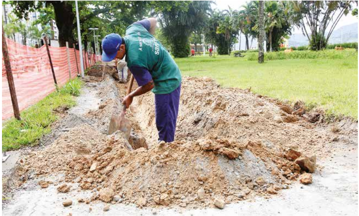
Obra é executada por trecho, visando reduzir os impactos para os usuários da ciclovia, que tem mais de 12 anos

especial de drenagem e cabeamento de dutos para embutimento da iluminação e replantação de canteiros verdes para ampliar as áreas de infiltração.