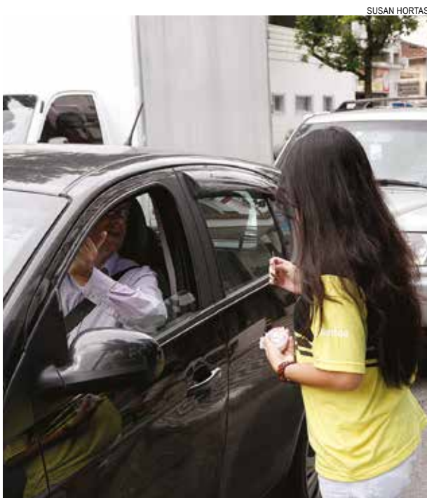
Campanha visa aumentar a segurança dos pedestres