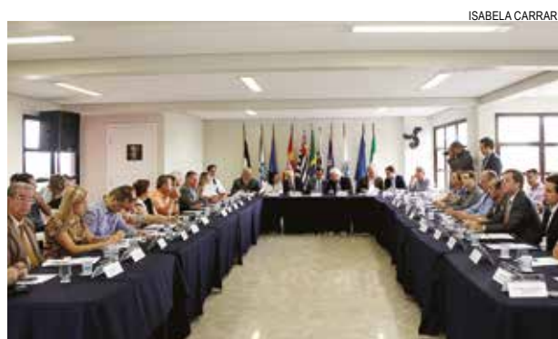
Secretaria estadual expôs assunto em reunião do Condesb

ERA O ÍNDICE DE PARTICIPAÇÃO ANTES DO PROGRAMA.