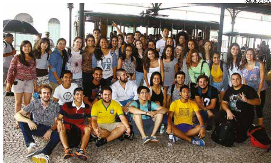
Originários de vários países, os 23 jovens se encantaram com o passeio no bonde

Hospedados em casas de famílias da Cidade há uma semana, o grupo ficará na Baixada Santista até o final de fevereiro. Durante este período, os intercambistas darão aulas de idiomas, esportes e direitos humanos em diversas ONGs da Baixada Santista.