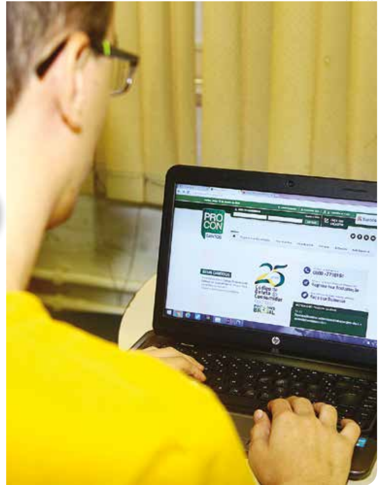
Acessos por notebook ou computador representam 74% do total