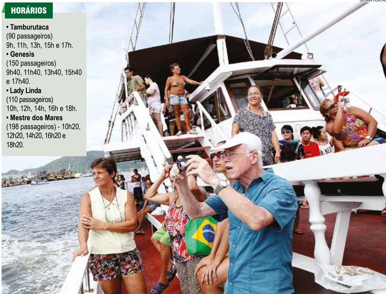
Passeios são comemorativos aos aniversários da Cidade e do Porto, além do Dia do Trabalhador Portuário

Embarques serão feitos na Ponte Edgard Perdigão