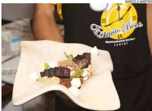
Tiramisu desconstruído é inspirado em doce italiano

Embarques serão feitos na Ponte Edgard Perdigão