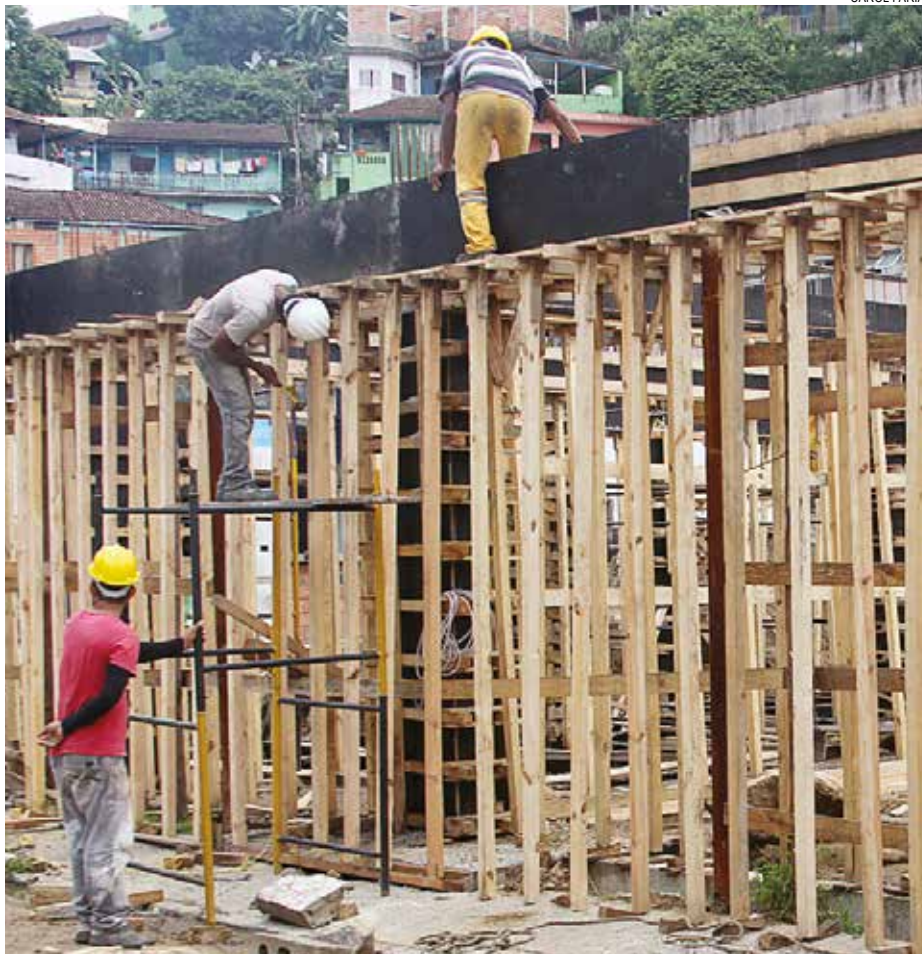
Licitações incluem compra de material de construção civil, medicamentos etc

Lançado em 29 de abril de 2015 pela Prefeitura, o LicitaSantos é coordenado pela Secretaria Municipal de Gestão (Seges), com cooperação da Associação Comercial de Santos (ACS), Câmaras de Dirigentes Lojistas (CDL) Santos e Santos Praia e do Sindicato do Comércio Varejista da Baixada Santista, que ajudam na divulgação do programa junto aos seus associados.