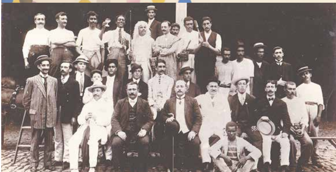
Clube dos Girondinos. Esta é uma rara foto de uma agremiação de carnaval da época dos Congressos. Nota-se que, entre os distintos membros, há foliões mais desinibidos

São tantas as memórias de Carnaval que contá-las em uma só página é tarefa difícil, tanto quanto conhecer um santista que não se orgulhe dessa bela história.