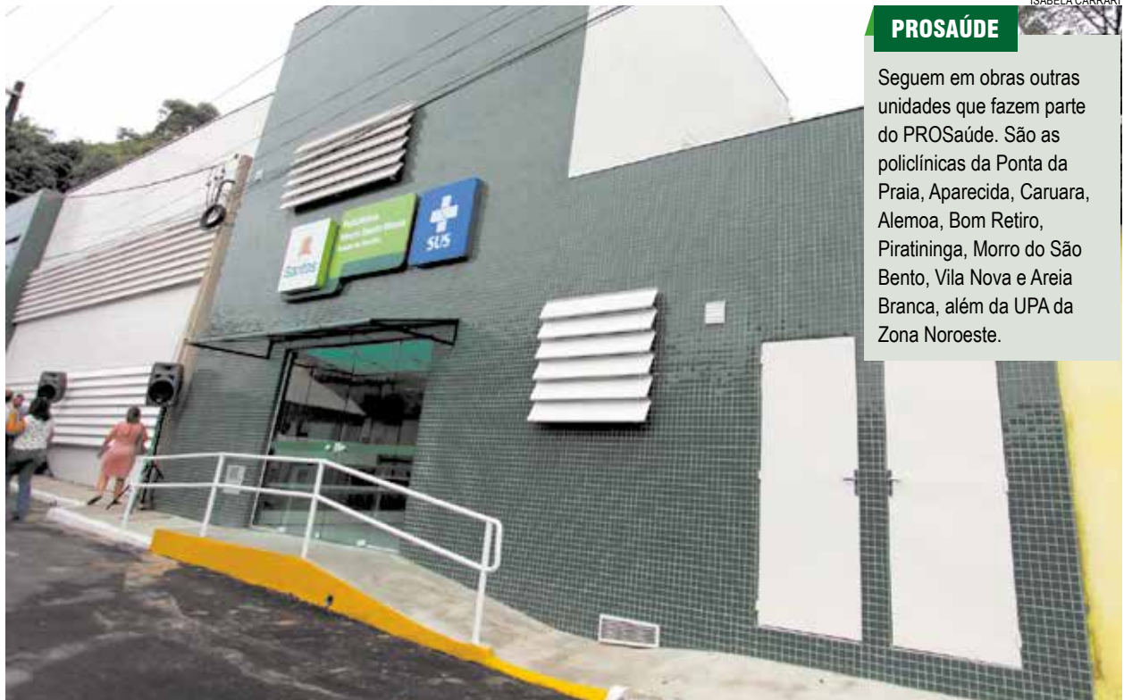
Ampliação no número de consultórios e salas permitirá o aumento de consultas e procedimentos

A construção da policlínica do Santa Maria custou R$ 1,4 milhão, recursos dos governos municipal, estadual e federal. Além disso, o apoio da comunidade foi essencial para deixar a unidade de acordo com os anseios dos moradores. Diversos deles participaram da obra.