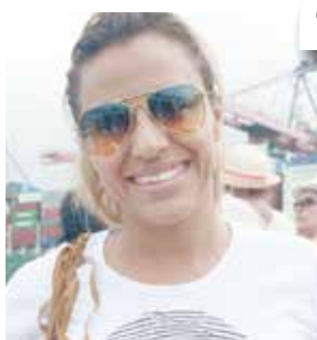
A bordo de escunas, passageiros puderam contemplar instalações portuárias e pontos históricos de Santos

“Esse roteiro, além de lazer, proporciona conhecimento”