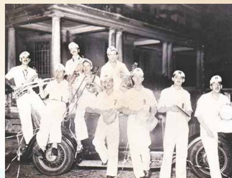
Um grupo carnavalesco ao lado de um carro para corso