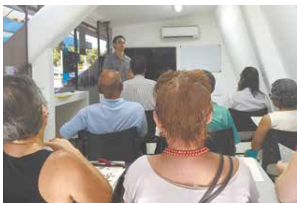
Aula de tai chi chuan (acima) e palestra sobre remédios