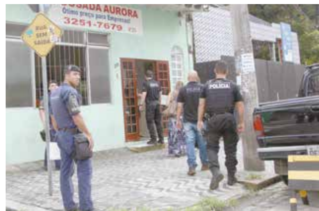
Iniciativa integrada, voltada a setores de comércio e serviços, reuniu Prefeitura e as polícias Civil e Militar

Ação dirige-se a infrações de posturas e saúde