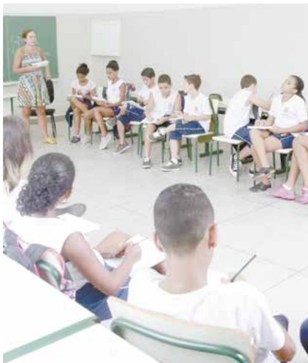
Estudantes falaram sobre si e se apresentaram à classe