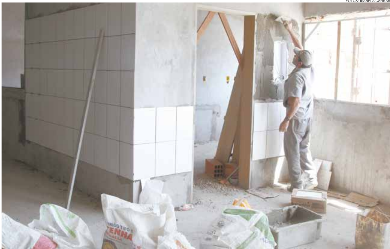
Uma das etapas do acabamento é o revestimento em áreas internas, como cozinha, refeitório e banheiros

Equipamento reúne outros serviços de apoio social