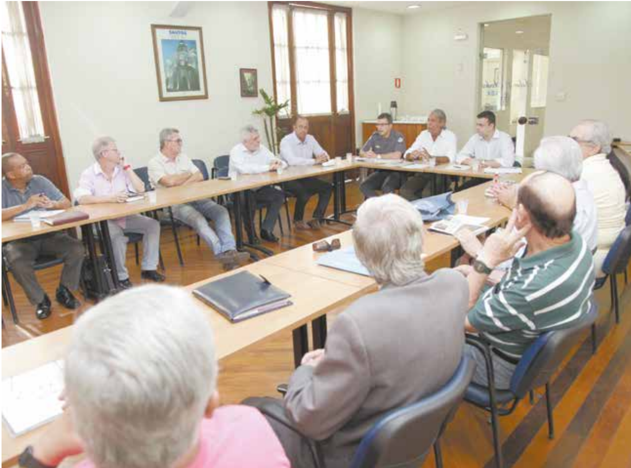
Balanco da operação deste ano foi apresentado durante reunião do Conselho de Segurança do Município

As informações foram divulgadas ontem pelo