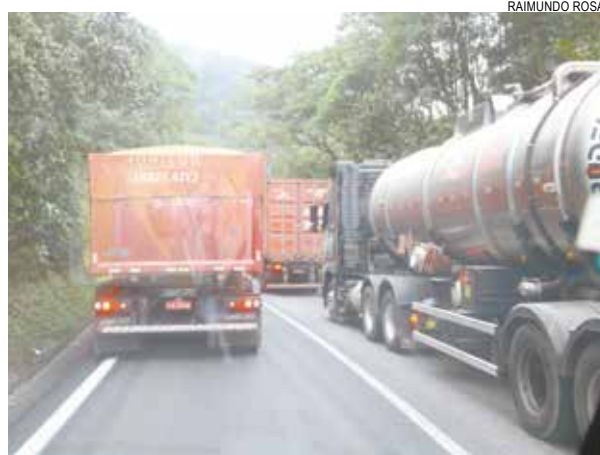
Escoamento de grãos campo/porto requer sincronismo

Convênio assinado entre Codesp e CET Santos permite a atuação de integrantes da Guarda Portuária como agentes de trânsito. Com duração de um ano, o acordo autoriza guardas portuárias a fiscalizar regras e normas regidas pelo Código Nacional de Trânsito (CNT) nas vias portuárias. A estimativa é de que cerca de 9 mil caminhões passem diariamente nas duas margens dos cais santista.