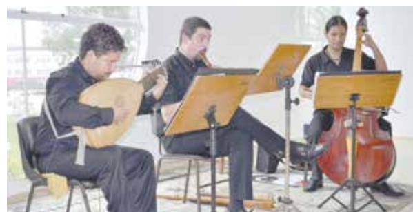
Grupo foi formado em Cubatão e atua desde 1974

O projeto Sexta com Arte apresenta, no Centro de Atividades Integradas (Cais) Milton Teixeira (Av. Rangel Pestana, 150, Vila Mathias), na sexta-feira às 19h30, o grupo cubatense Rinascita de Música Antiga. Entrada gratuita.