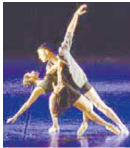
Festival será realizado entre 25 e 29 de maio

Companhias de dança interessadas em participar das mostras competitivas da 3ª edição do Fidifest têm até sábado para se inscrever. Já para os workshops, as inscrições ficam abertas até o dia 20 de maio. O cadastro pode ser feito pelo site http://fidifest.com.br .