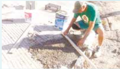
Pintura do complexo do Mercado Municipal - Vila Nova