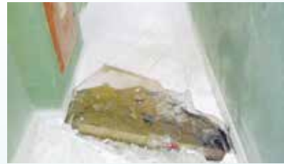
Substituição de rede hidráulica de incêndio do Arena Santos - Vila Nova