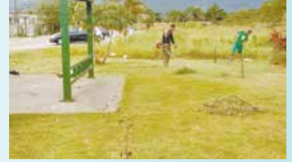
Roçada de mato na Av. Andrade Soares - Caruara