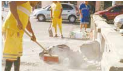
Retirada de entulho canal da Av. Campos Sales - Vila Mathias