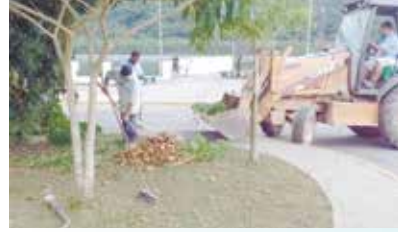
Operação Cata Treco e retirada de lixo nas ruas - Caruara