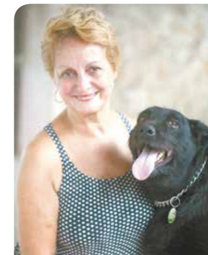
Cleonice Rebecchi Duque e Karu, 5 anos. Fazia parte de uma ninhada abandonada nas proximidades da Codevida.