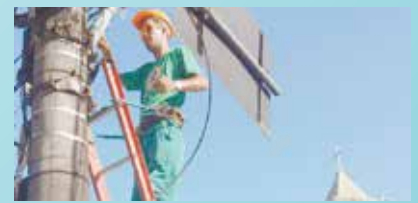
Colocação de cordão festivo - Morro Nova Cintra