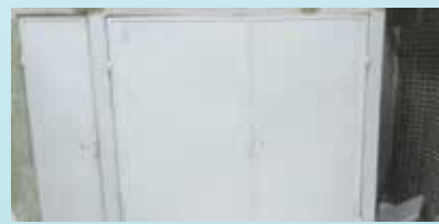
Colocação de portões no Cecon Santa Maria