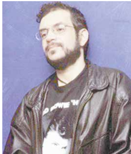
Tributo a Renato Russo e show de Didi Gomes são as atrações de amanhã e sábado

ORLA DO GONZAGA, AO LADO DO CANAL 3 INFORMAÇÕES: WWW.SANTOS.SP.GOV.BR