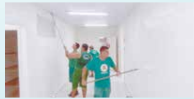
Pintura do Serfis - corredores e salão do atendimento - Bom Retiro