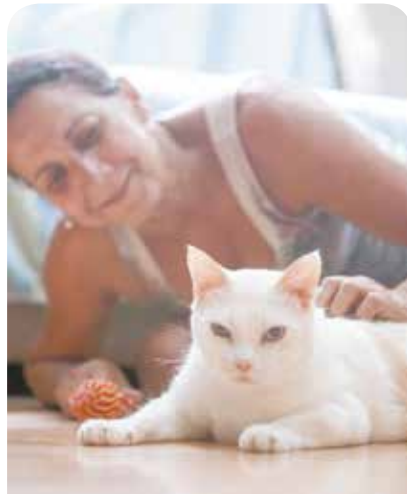
Maria da Glória Duarte e Apolo, 5 anos Vivia com outros 38 animais na casa de um acumulador de gatos. Todos foram castrados na Codevida.