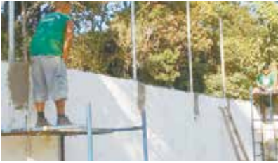
Instalação de tela e alambração no Núcleo da Escola Total - Caruara