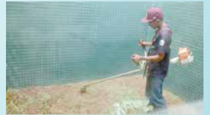
Corte de grama na Policlínica Vila Nova