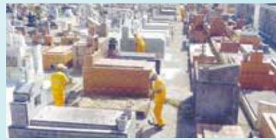
Raspação e capinação na quadra do jazigo 2 do cemitério do Areia Branca