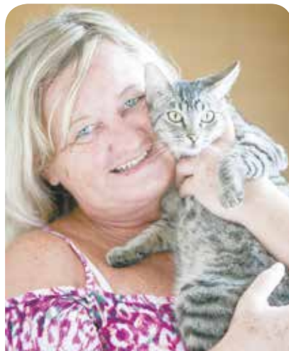
Lucilene Cieplinsk e Estella, 1 ano Com deficiência nas patas traseiras, foi abandonada na porta da Codevida.