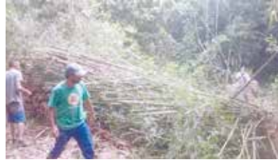
Limpeza do rio Iriri-Macuco. Corte e retirada de árvores.