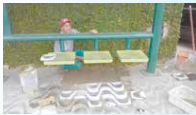
Reparo em calçada de ponto de ônibus na Praça Rebouças - Ponta da Praia