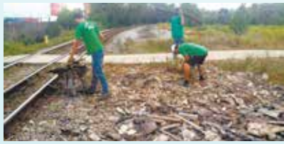
Limpeza geral da Vila dos Criadores com apoio da empresa MRS - Alemoa