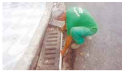
Reparo em grelha de boca de lobo na Av. Pedro Lessa - Embaré