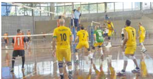
Competição teve a participação de 102 equipes

Com mais de 1,4 mil atletas de diversos estados, a 14ª edição do Campeonato Brasileiro Master Santos de Vôlei foi realizada no final de semana, no Internacional de Regatas.