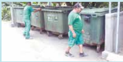
Colocação de contentores de lixo na baía na Rua 1 - Morro Santa Maria