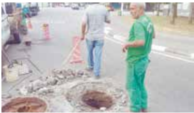
Troca de tampa de poço de visita na Praça Rebouças x Rua Jurubatuba - Ponta da Praia