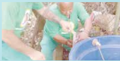
Instalação de uma caixa d'água na base da Polícia Militar no Cruzeiro - Morro São Bento