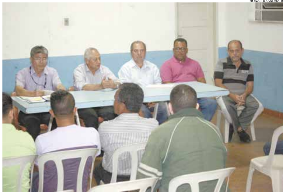
Prefeitura teve encontro com os moradores para detalhar a modernização

SOLICITAÇÕES DE REPAROS: 0800-112056 OU OLVIDORIA@SANTOS.SP.GOV.BR SEGUNDA A SEXTA-FEIRA, DAS 8H ÀS 18H