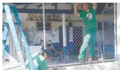
Colocação de tela alamedada na Sociedade Esportiva - Caruara