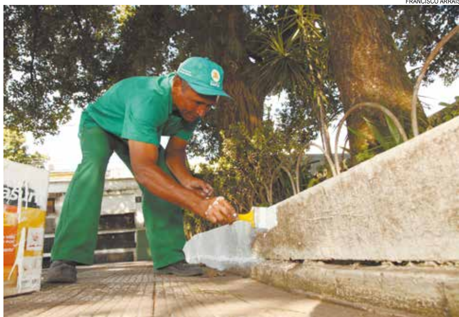
Intervenções são executadas por funcionários da Suprefeitura da Região Central Histórica

zer para os moradores, os três conjuntos de mesas com quatro bancos cada para jogo de xadrez, já existentes, serão mantidos no local. Também será instalada iluminação.