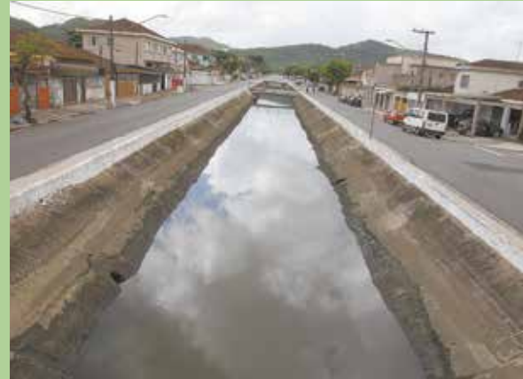
Av. Jovino de Melo será uma das beneficiadas