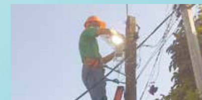
Colocação de refletores na Rua F - Morro José Menino