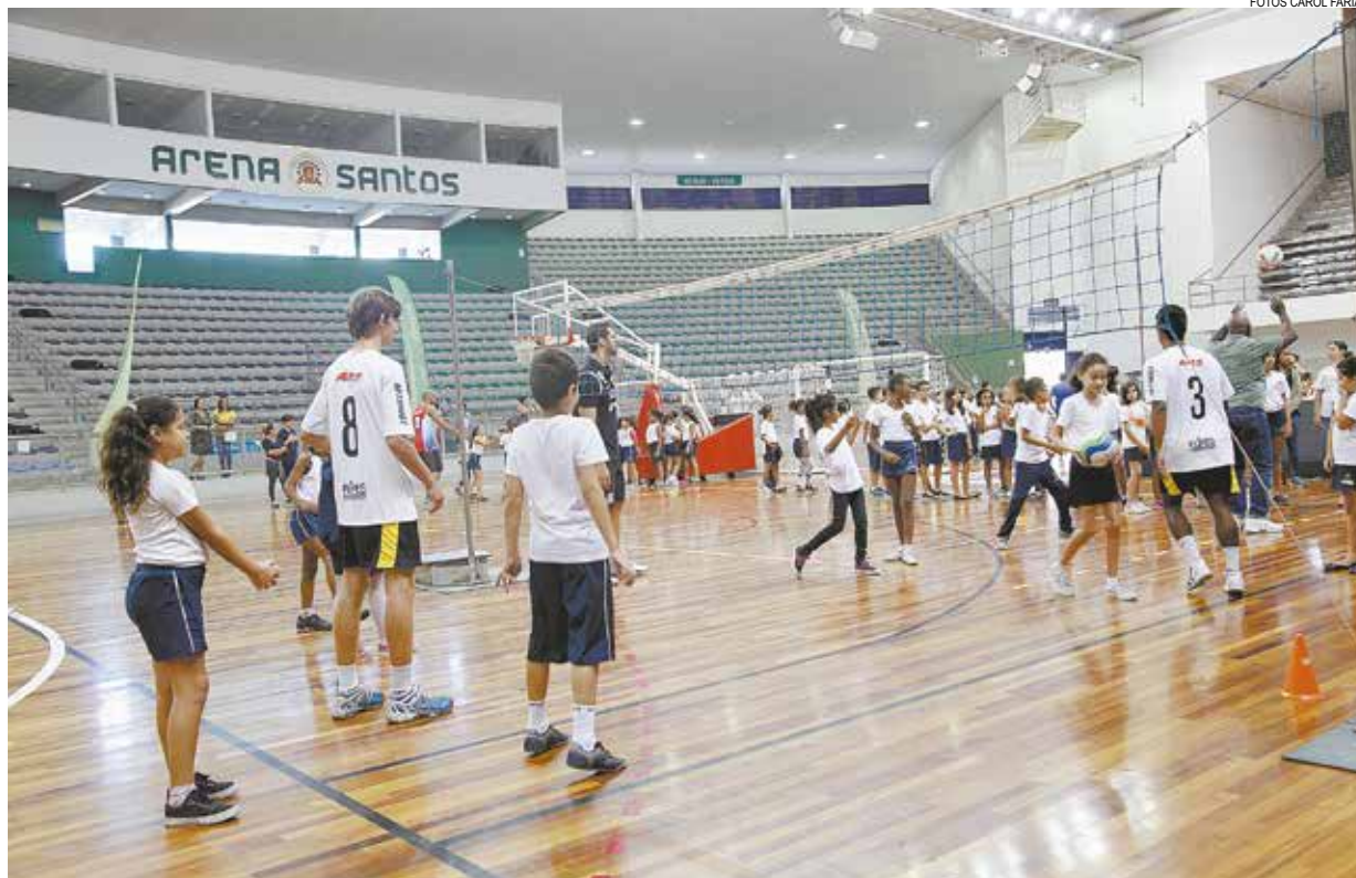
Alunos do Escola Total foram divididos em quatro estações e orientados por professores, atletas e técnicos

Grandes nomes da história do esporte brasileiro estiveram presentes. O santista Jo-