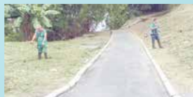
Poda de jardins e árvores em toda a extensão do Cruzeiro - Morro São Bento