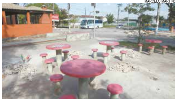
Obra atende reivindicação feita pelos moradores

Os pilares antigos já foram demolidos e, ontem, iniciada a armação dos