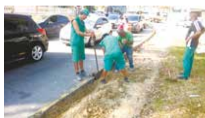
Reurbanização da Praça Gomide Ribeiro - Embaré