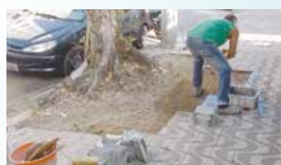
Reparo em calçadas danificadas por raízes - Marapé