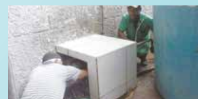
Substituição de moto bomba na UME Wanderley de Almeida - Santa Maria