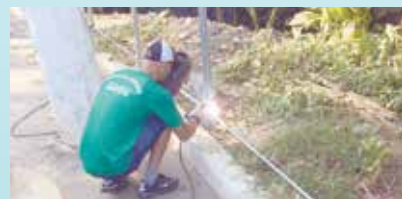
Colocação de alamedados na Rua 1 - Morro Santa Maria