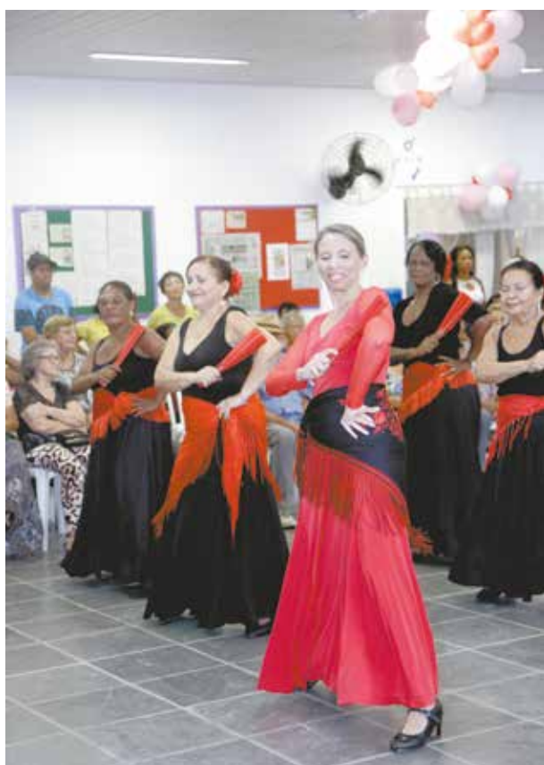
Programação contou com grupos de dança e música