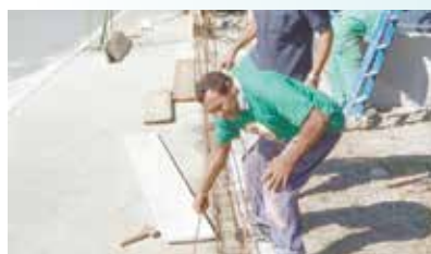
Construção de baldrame para elevação de muro na Sociedade Esportiva - Caruara