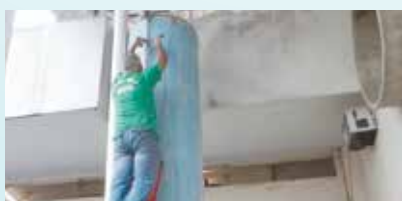
Instalação da iluminação no pátio da UME Oswaldo Justo - Chico de Paula