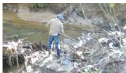
Limpeza e retirada de vegetação do Rio Iriri-Macuco - Caruara