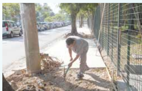
Preparação para concretagem da calçada do Teatro Municipal - Vila Mathias