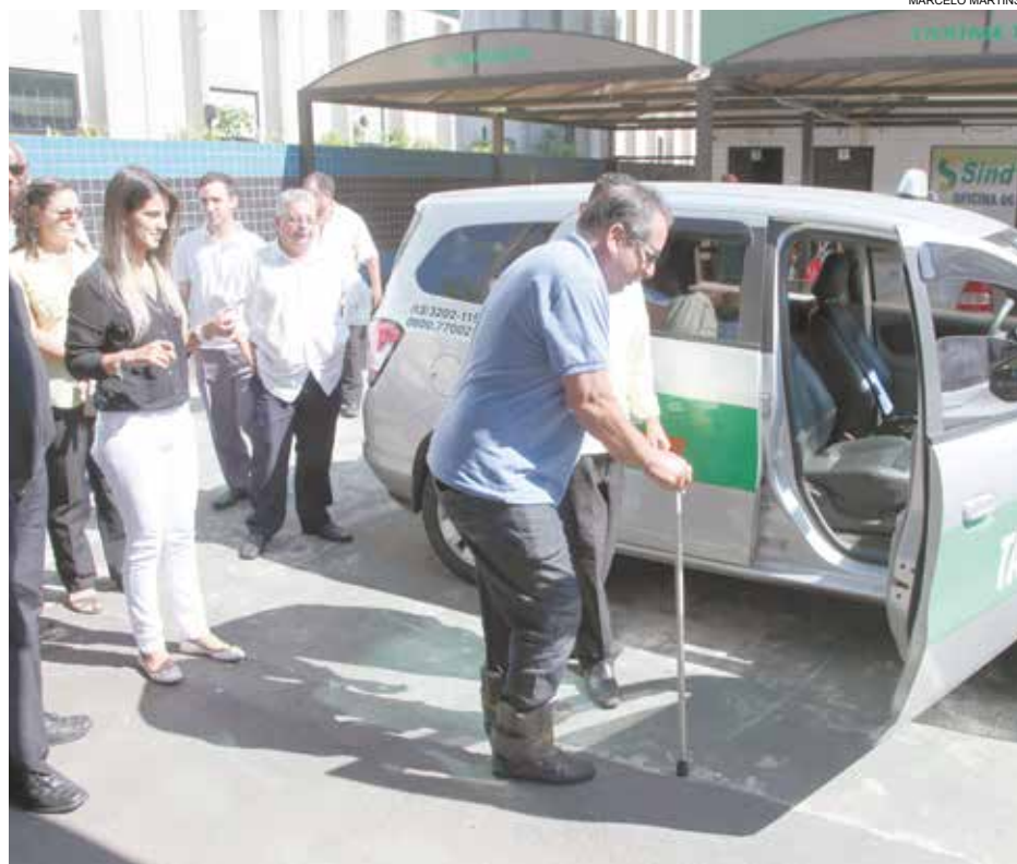
Simulações e palestras ensinam como lidar com quem tem dificuldades de locomoção

Os motoristas inseridos no programa recebem cer-