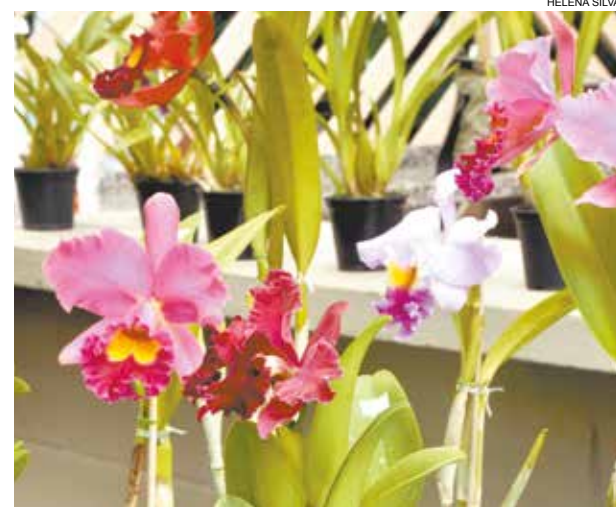
Orquídeas estarão à venda com preços a partir de R$ 10

Serão realizados dois sorteios. O primeiro às 10h30 e o segundo às 12h. A cada R$ 25 em compras em uma mesma barraca, os consumidores ganham