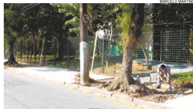
Serão construídos 370 m lineares de passeio

Em concreto desempenado mecanicamente com acabamento em bambolê (equipamento para deixar o piso liso), o novo passeio segue o padrão do programa Calçada para Todos.