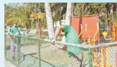
Pintura dos aparelhos da academia ao ar livre na Praça Encarnacion Alves Corpas - Caruara