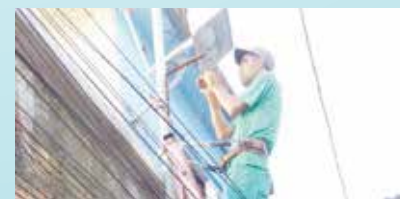
Colocação de refletores - Morro José Menino