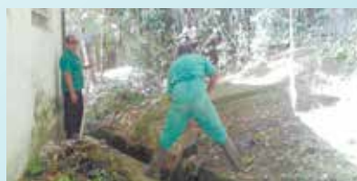
Limpeza da Escola Bartolomeu de Gusmão - Saboó