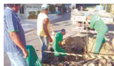
Reparo em abatimento na Rua Adolfo Lutz com Rua Irmão José Isidoro - Ponta da Praia