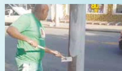
Pintura de postes na Rua Álvaro Alvim - Embaré