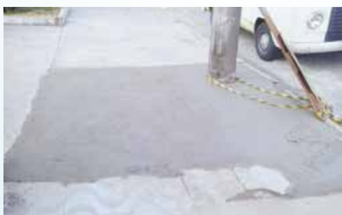
Conserto de calçada na Av. Conselheiro Nébias - Vila Mathias