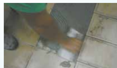
Reposição de piso no WC do Colégio Santista - Vila Nova