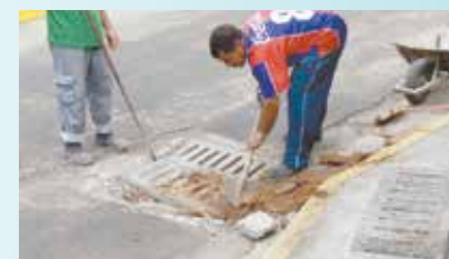
Troca de boca de lobo na Rua Principal - Monte Cabrão