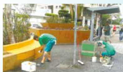
Pintura da Praça Armando Martins Clemente - Embaré