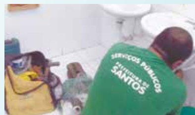
Substituição de flexível na Escola Irmã Dolores - Vila Nova