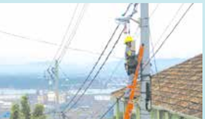
Reparo na iluminação no Caminho Monseñor Moreira - Monte Serrat