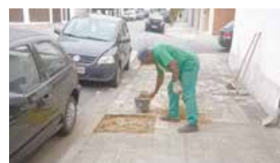
Abertura de covas para plantio de árvores na Av. Pinheiro Machado - Vila Belmiro