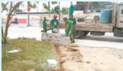
Assentamento de cordonéis no entorno dos jardins na Praça Albertino Moreira - Caneleira