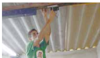
Instalação de calhas luminárias na Soc. Esportiva do Caruara