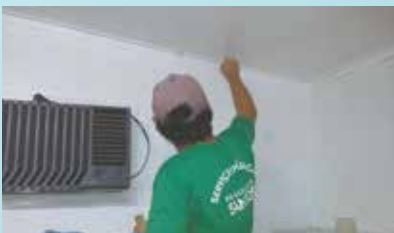
Pintura na Sociedade de Melhoramentos do Monte Serrat