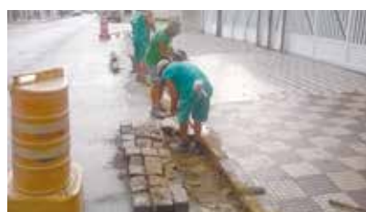
Renivelamento de sarjeta na Rua Osvaldo Côchrane - Embaré