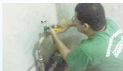
Manutenção do sistema de bomba hidráulica da UME Avelino da Paz Vieira - Vila Nova