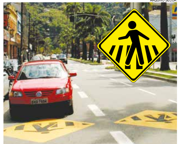
Pictogramas indicam existência de Faixa Viva à frente

Aos pedestres, a CET está sinalizando a extremidade das faixas com a inscrição "Faixa Viva", junto ao meio fio, exatamente onde se inicia a travessia. A pintura já foi executada em mais de 60 locais, especialmente nas vias com fluxo intenso, e seguirá nas demais ruas e avenidas da Cidade.