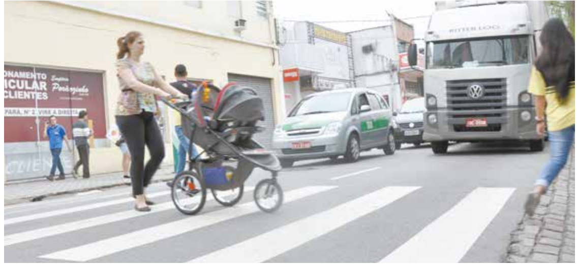
Campanha dá prioridade de travessia aos pedestres nas faixas onde não há semáforo

via sobre as faixas delimitadas para esse fim terão prioridade de passagem, exceto nos locais com sinalização semafórica, onde deverão ser respeitadas as disposições deste Código".