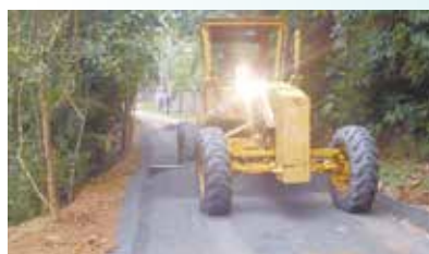
Nivelamento com bica corrida na Rua Antonio Mineiro - Caruara