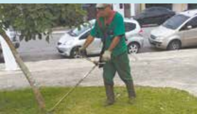
Corte de grama na Praça Guadalajara - Morro Nova Cintra