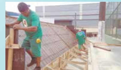
Execução das ferragens da arquibancada na Praça Guilherme Délius - Alemoa