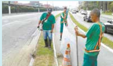
Corte de grama na ciclovia da Av. Martins Fontes - Sabó