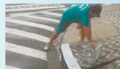
Pintura de guias e postes na Rua Conselheiro Lafaiete e Conselheiro Ribas - Embaré