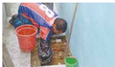
Limpeza e desentupimento de caixa de gordura na Creche Monte Cabrão