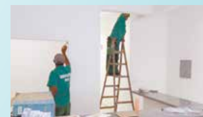
Pintura interna do SENAT - Macuco