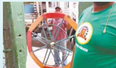
Execução de reparos no playground do Jardim Botânico - Bom Retiro