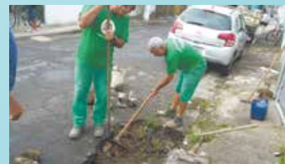
Manutenção em rede de drenagem finalizada na Rua São Luiz - Morro São Bento