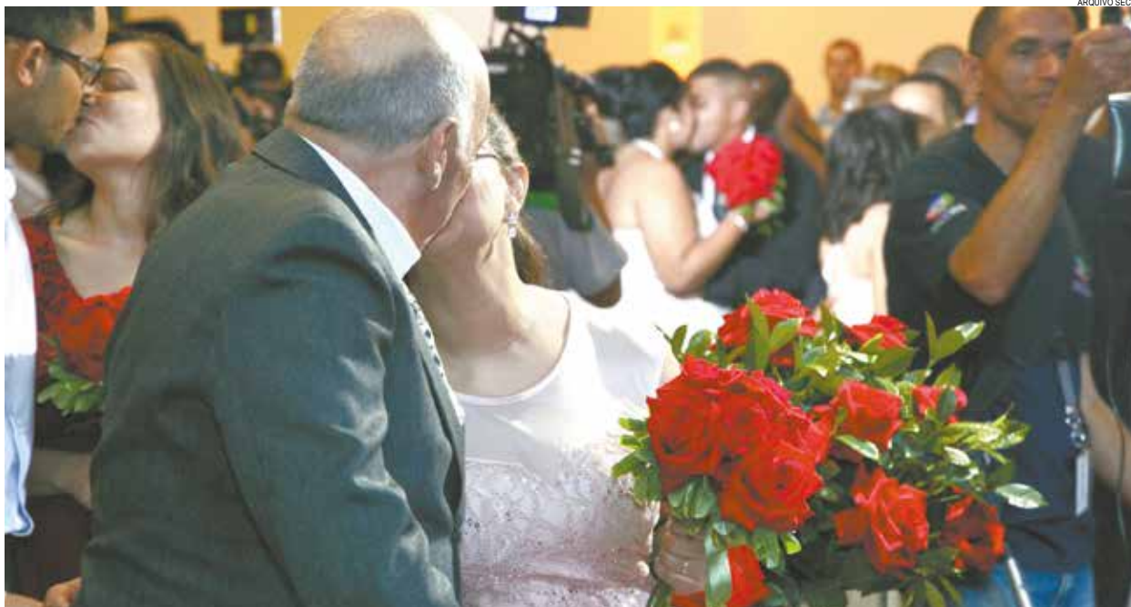
Cerimônia para oficializar a união dos casais está marcada para o dia 14 de setembro, no clube Vasco da Gama

A solenidade será dia 14 de setembro, no Vasco da Gama (Avenida Saldanha da Gama, 33/35, Ponta da Praia). Desde 2013, mais de 200 casais oficializaram a união gratuitamente.