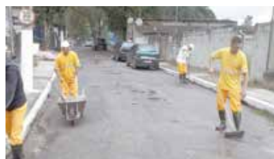
Limpeza e varrição da Av. Principal - Monte Cabrão