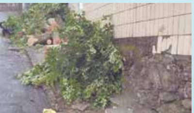
Corte de árvore na Rua São Miguel - Morro São Bento