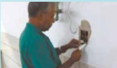
Manutenção em interruptores na Escola Rubens Lara - Nova Cintra