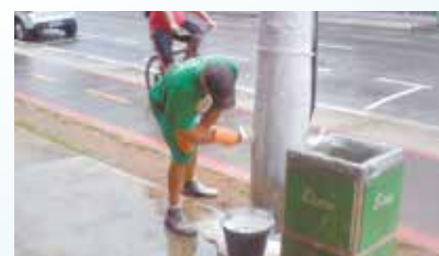
Pintura de postes na Rua João Pessoa - Centro