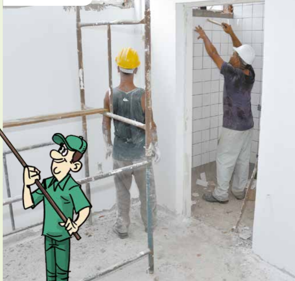
Policlínica Alemoa Alemoa