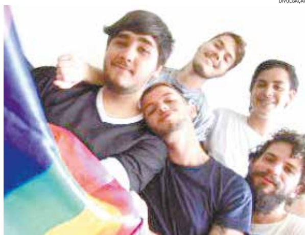
Exibição do filme marca o dia de combate à homofobia