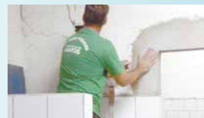
Rejunte nos revestimentos e lixamento de paredes para pintura geral na Soc. Esp. do Caruara