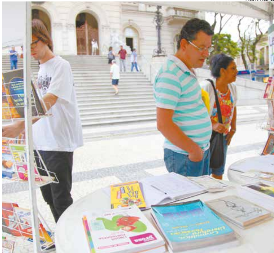
Com distribuição de publicações, projeto estará na Praça Mauá das 10h às 14h