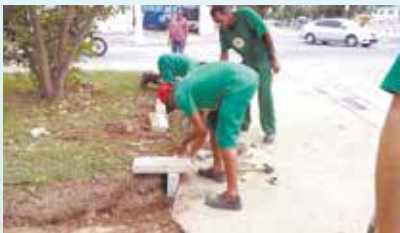
Assentamento de cordonéis na Praça Albertino Moreira - Caneleira