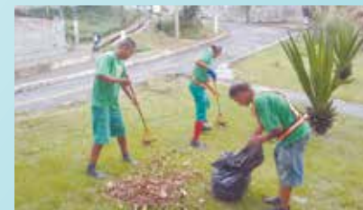
Limpeza da entrada da Cidade em viaduto e praças e retirada de entulho - Alemoa