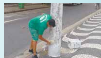
Pintura dos postes e entrada das ruas na Av. Washington Luís - Canal 3