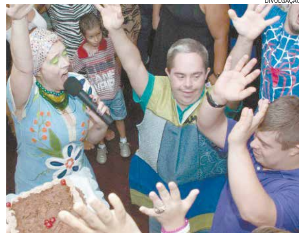
Estão programadas intervenções, shows e oficinas

A abertura, sábado, às 20h, será com a exposição permanente Abraça A Tua Loucura Antes que Seja Tarde , assinada pelos alunos das oficinas de fotografia da ONG. A agenda também traz a videoinstalação Eu Sou TAM-TAM ; o Bazar & Artesanato , com a Apae Santos, Lar das Moças Cegas, Nurex, Programa de Habilitação do Deficientes – Ser-