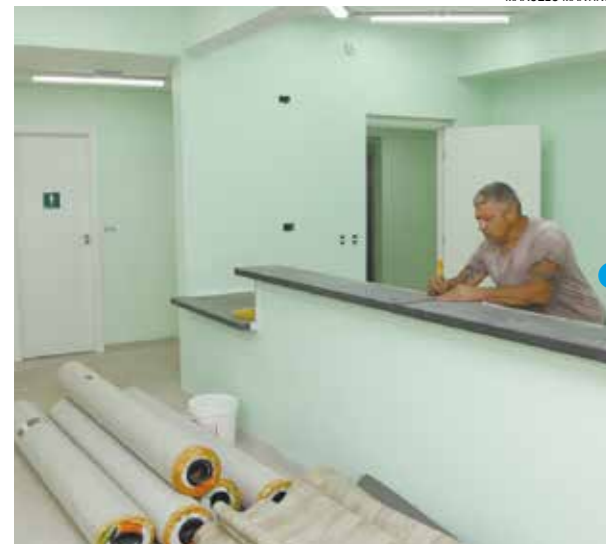
Em fase final de construção, unidade do Bom Retiro está 85% executada

Mais da metade das 13 policlínicas previstas dentro do programa de requalificação de unidades de saúde já foi entregue. São quatro novos prédios: do Morro Santa Maria, Caruara, Ponta da Praia e Vila Nova; três reformas, no Marapé, no Gonzaga e Monte Serrat. Outros seis edifícios estão sendo construídos. Isso ocorreu em pouco mais de três anos. O total de investimentos do programa PROSaúde é de R$ 80 milhões, que inclui outras melhorias no setor.