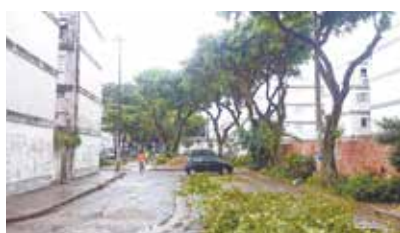
Poda no BNH - Aparecida