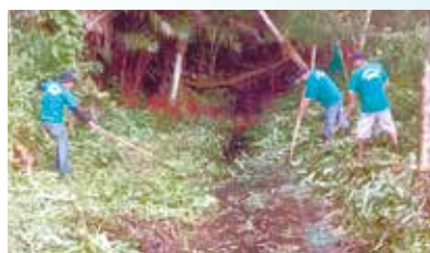
Roçada de mato no valão da Marginal da Rio-Santos - Caruara