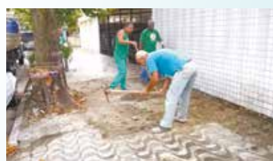
Reparo em calçada da Rua Vital Brasil - Vila Belmiro