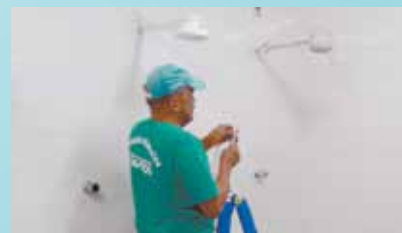
Manutenção em chuveiros no almoxarifado da Subprefeitura dos Morros - Nova Cintra