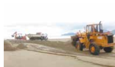
Remanejamento de areia no entorno do Canal 3 - Boqueirão