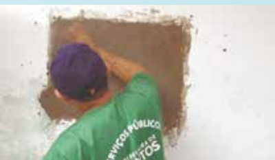
Reparo em paredes na Sociedade de Melhoramentos - Monte Serrat