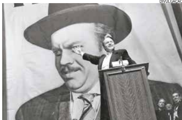
Filme de Orson Welles completa 75 anos em 2016

A abertura, hoje, será com as produções Cidadão Kane (16h), Verdades e Mentiras (18h30) e MacBeth (21h). Amanhã tem Falstaff – O Toque da Meia Noite (16h), Soberba (18h30) e A Dama de Shangai (21h). Confira no quadro os filmes dos próximos dias.