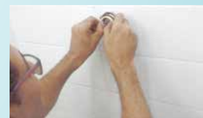
Conserto vazamento da Coetel - Centro