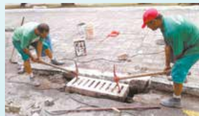
Colocação de boca de lobos na Av. Getúlio Vargas - Valongo