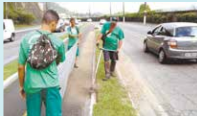
Corte de grama na Av. Martins Fontes - Saboó