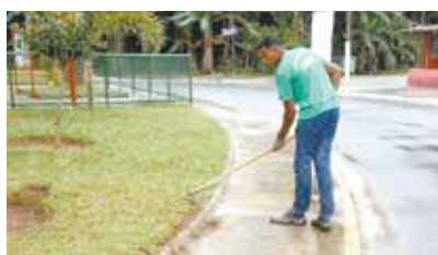
Manutenção e limpeza do jardim na Praça Encarnacion Alves Corpas - Caruara