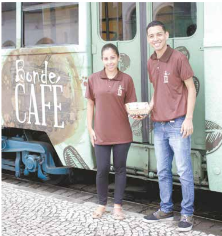
Jovens integram terceira turma de capacitação do restaurante-escola e se revezarão no atendimento aos passageiros