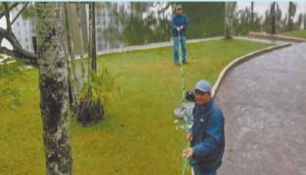
Instalação de cordão festivo na Lagoa da Saudade - Morro Nova Cintra