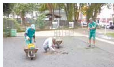
Reparo em piso em mosaico na Praça Caio Ribeiro de Moraes e Silva - Aparecida