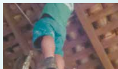
Manutenção no telhado da Casa do Trem Bélico - Valongo