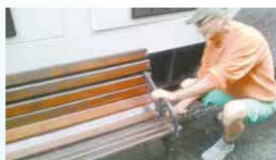
Instalação de banco na Rua XV de Novembro - Centro