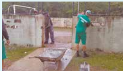
Demolição de mureta de fechamento do campo da Praça Euzébio Rocha - São Manoel