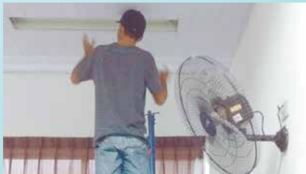
Troca de lâmpadas na Escola Rubens Lara - Morro Nova Cintra