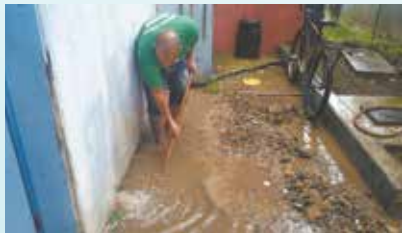
Conserto de tubulação rompida na UME Esmeraldo Tarquínio - Bom Retiro