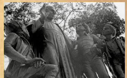
Monumento do Padre Champagnat, em foto dos anos 1980

Santista, cujas aulas se iniciaram em 4 de abril de 1904. Esta unidade de ensino se tornou uma das mais tradicionais na Cidade até que, em 2008, teve seu último ano de funcionamento.