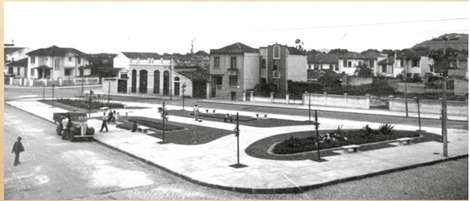
A Praça 539 começa a receber melhorias e é urbanizada. Em pouco tempo se chamaria Padre Champagnat, em homenagem ao fundador do Instituto dos Irmãos Maristas. Foto de 1944.