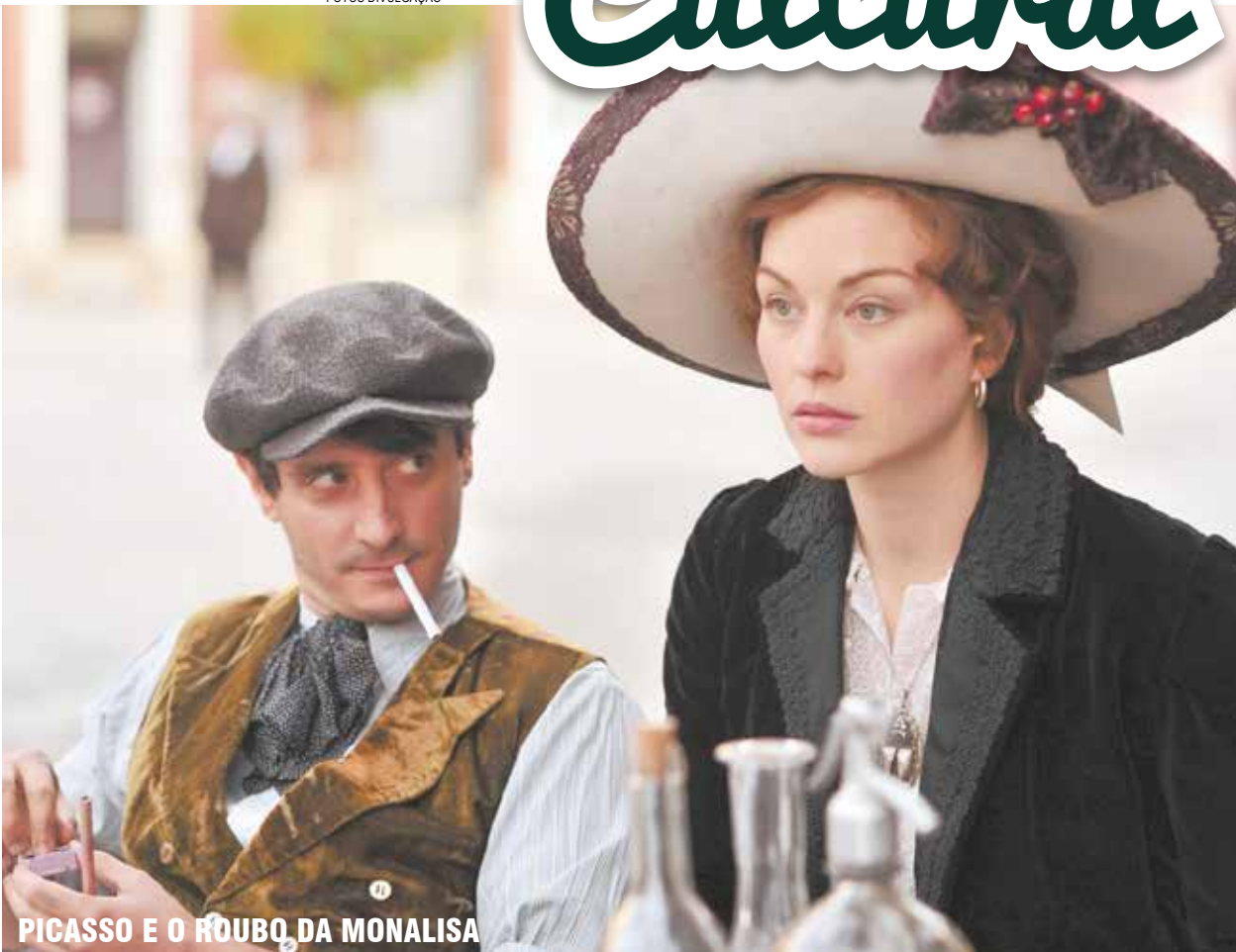
PICASSO E O ROUBO DA MONALISA