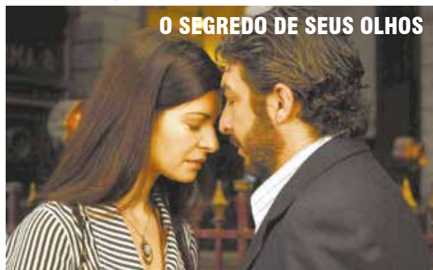
O SEGREDO DE SEUS OLHOS