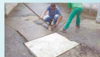
Troca de tampa de galeria na Rua Teodoro Sampaio - Jabaquara