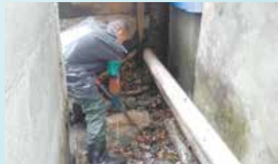
Limpeza de canal na Marginal Direita - Alemoa