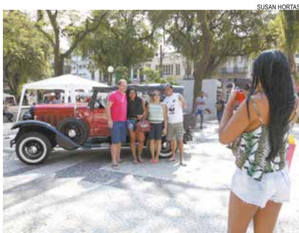
Preciosidades serão uma das atrações do ‘Feijão com Arte’