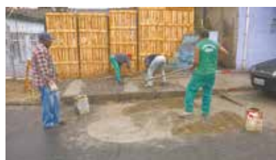
Calçada danificada por raízes de árvores na Rua Bezerra de Menezes - Estuário