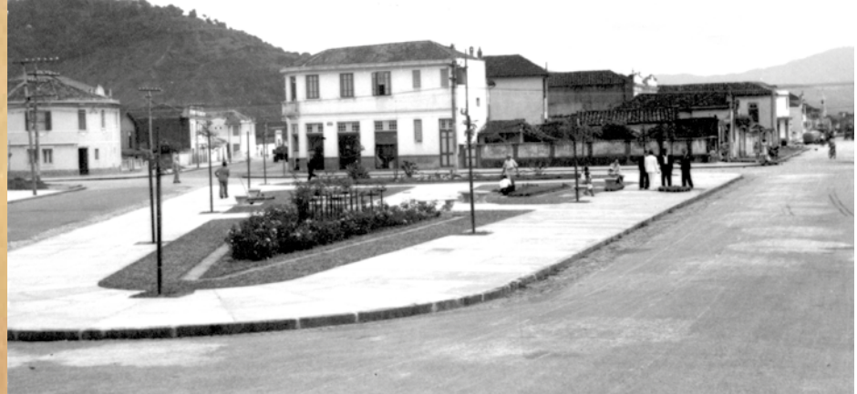
Outro ângulo da Praça 539, futura Padre Champagnat. À direita, a Rua da Constituição