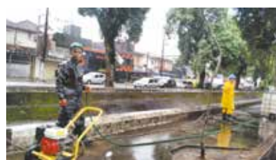
Lavagem do talude no canal 3 x Joaquim Távora - Vila Mathias