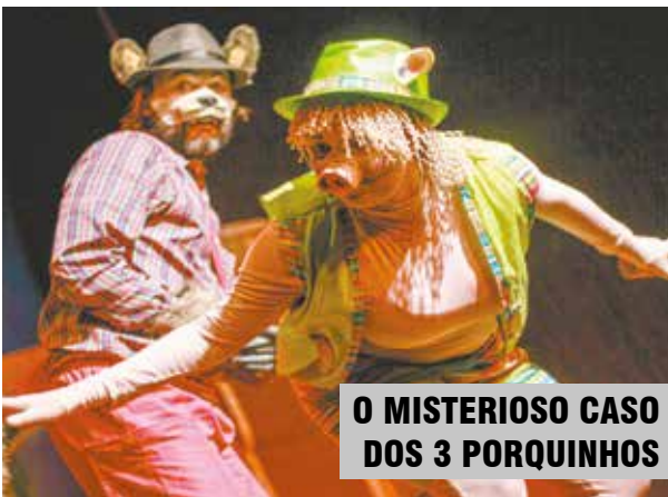
O MISTERIOSO CASO DOS 3 PORQUINHOS

Uma releitura cômica de um clássico conto infantil, o espetáculo, com canções tocadas e cantadas ao vivo, começa quando o Lobo Mau presta uma queixa à polícia. Ele alega que os porquinhos queimaram o seu rabo. A partir daí, um porco detetive entra em cena para investigar o caso. Hoje, às 14h, e amanhã, às 19h. Teatro Municipal Braz Cubas. 2º piso do Centro de Cultura Patrícia Galvão. Av. Senador Pinheiro Machado, 48, Vila Mathias. A entrada custa R$ 40,00 e pode ser adquirida na bilheteria do teatro. Outras informações pelo telefone 3226-8000.