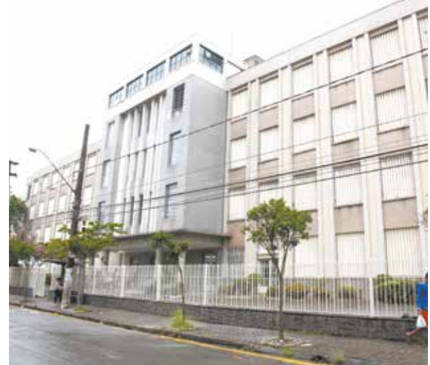
UME Colégio Santista é um dos locais de exame

Também é aconselhável levar o comprovante de pagamento bancário.