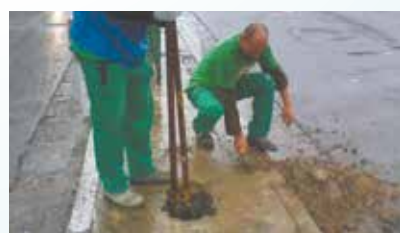
Instalação de tubos para a colocação de grades na Avenida Getúlio Vargas - Valongo