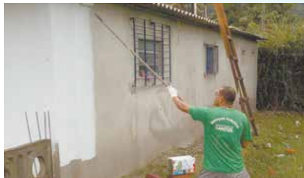
Serviços de pintura externa do salão e concretagem do piso externo na Soc. Esp. de Caruará