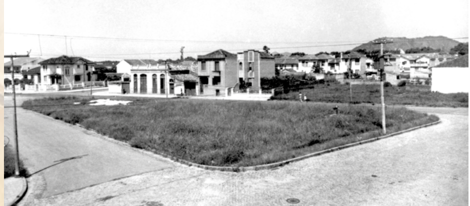
O pequeno terreno em formato de triângulo que fora cadastrado como Praça 539. No primeiro plano, as ruas Xavier Pinheiro e da Constituição. Ao longe, o trecho final da Rua Carvalho de Mendonça, esquina com Luís de Camões. Foto de 1941

Dizem que a estátua de Champagnat está de frente para a “Gota de Leite” justamente pela ligação do padre com a causa das crianças carentes.