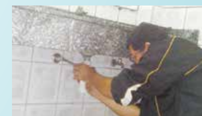
Troca de válvula de lavatório de pia da UME Colégio Santista - Vila Nova