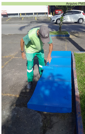
Pintura de bancos, lixeiras, guias e postes na Praça Dr. Altino Arantes, no Rádio Clube