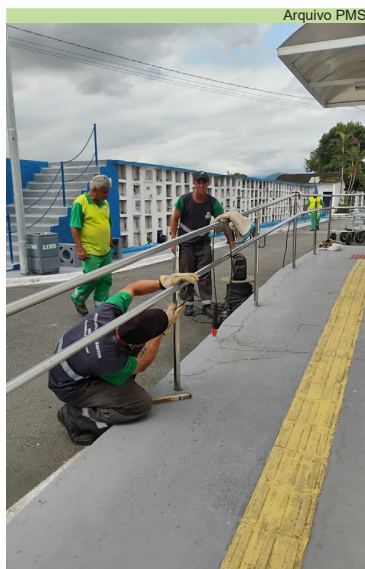
Soldagens nos corrimãos da administração e do velório no Cemitério Areia Branca