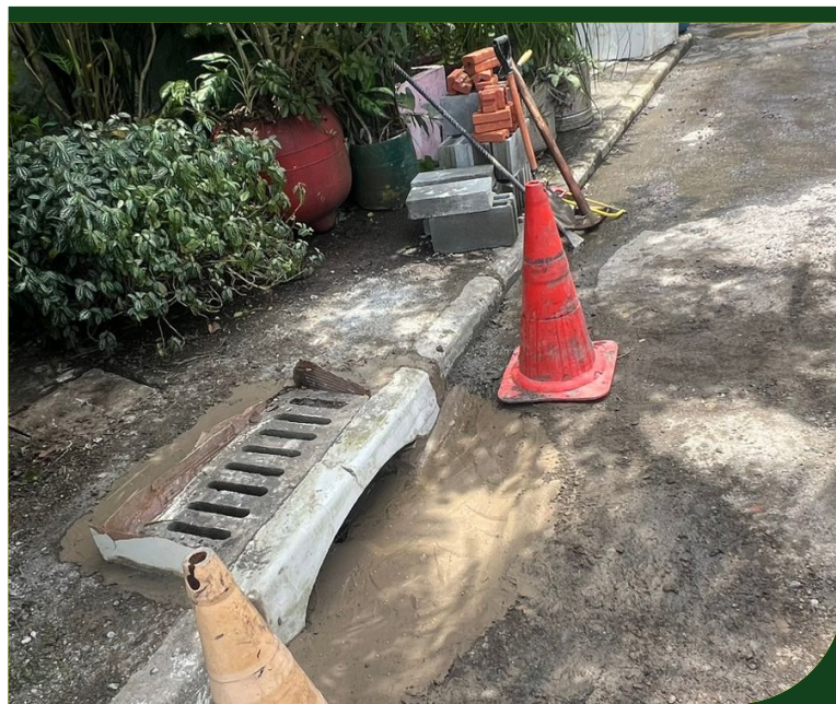
Instalação de Boca de Sapo, na Rua Principal, no Monte Cabrão