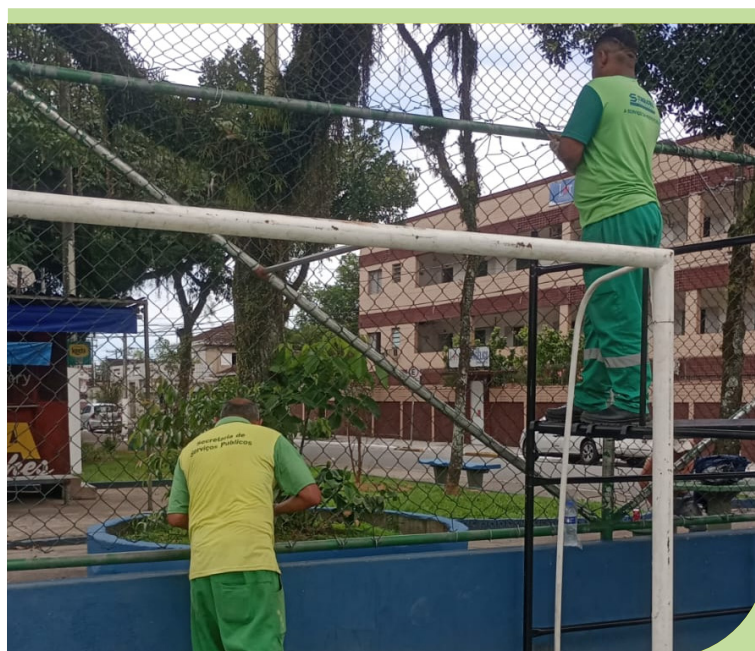
Reparos nos alambrados da quadra esportiva da Praça Engenheiro Prestes Maia, na Vila São Jorge