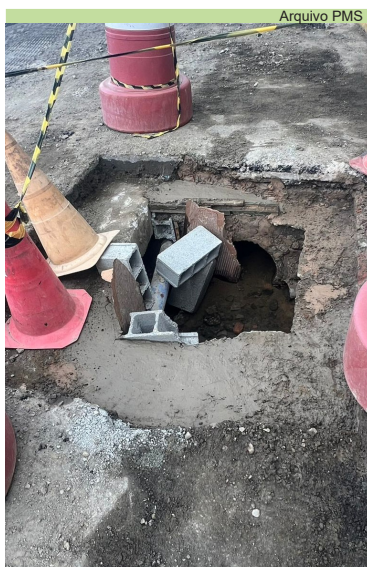
Reparo de caixa de passagem na Rua Principal, no Monte Cabrão