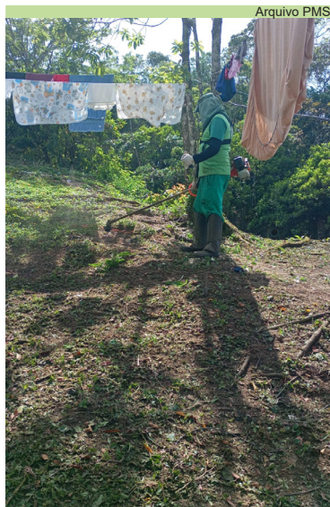
Serviço de Roçada e limpeza no Monte Cabrão