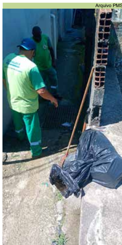
Limpeza de caixas e escada hidráulica na Rua 1, no Morro Santa Maria