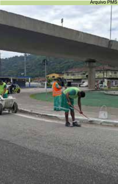
Pintura de guias da ciclovia da Avenida Nossa Senhora de Fátima