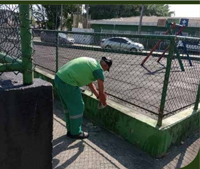
Amarração e esticamento de telas no playground na Praça da Paz Universal, no Castelo