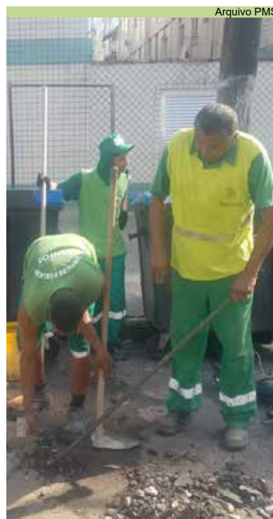
Manutenção asfáltica na Rua Xavier Pinheiro, na Vila Mathias