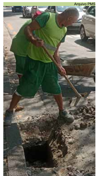
Troca de boca de lobo na Rua Alexandre Martins, na Aparecida