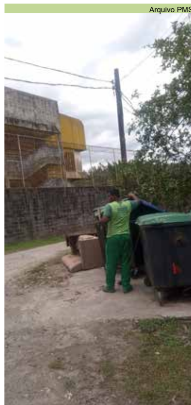
Varrição e limpeza pelas ruas do Monte Cabrão