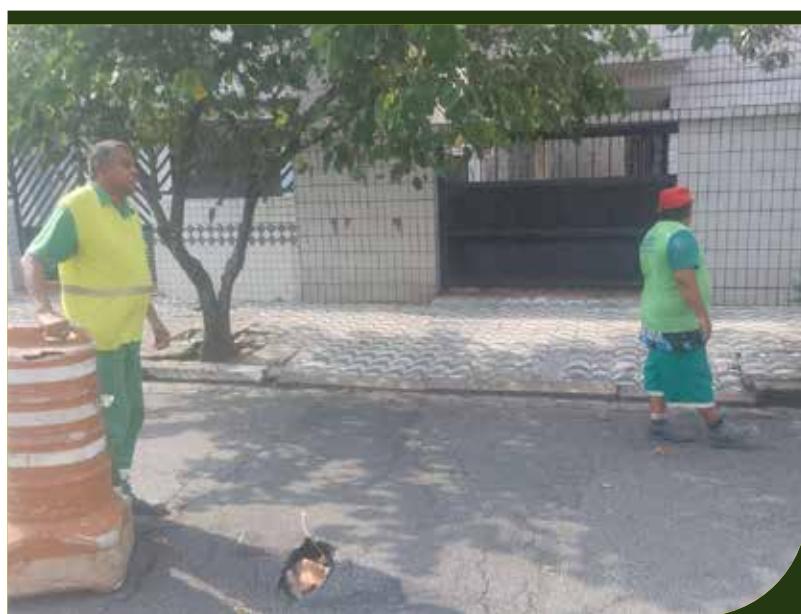
Manutenção asfáltica na Rua Francisco Otaviano, em frente ao número 38, na Vila Belmiro