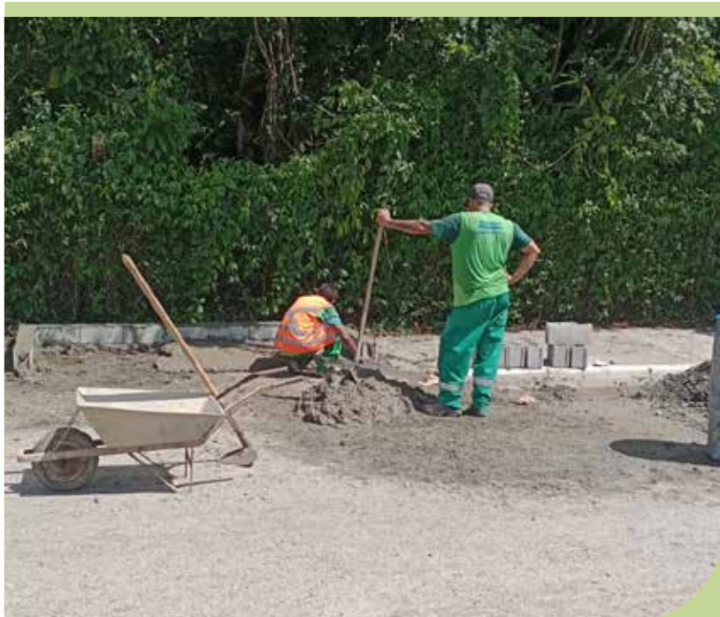
Construção de base para colocação de contendor de lixo na esquina das ruas Santo Antônio com Andrade Soares