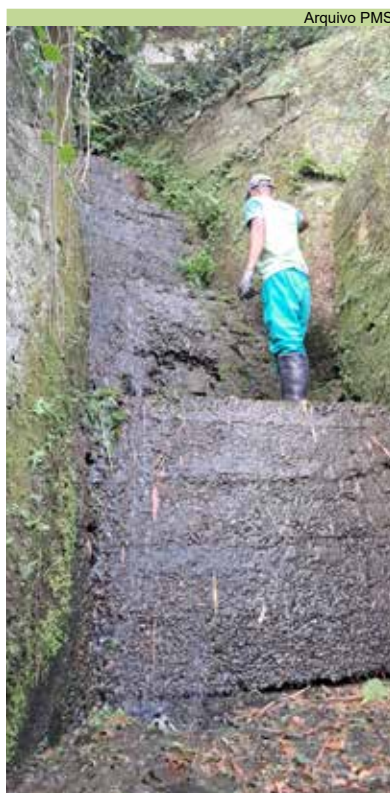
Limpeza de caixas e escada hidráulica na Rua 2, no Morro Penha