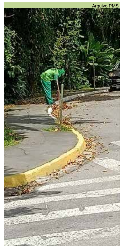
Varrição pela extensão da Rua Principal, no Caruara