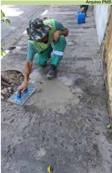
Tapa-buraco nas calçadas da Rua Maestro Antônio Garófalo