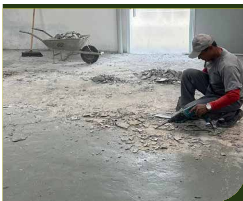
Regularização de contrapiso, retirada de entulho construção de piso na Casa do Tarzan, no Morro São Bento