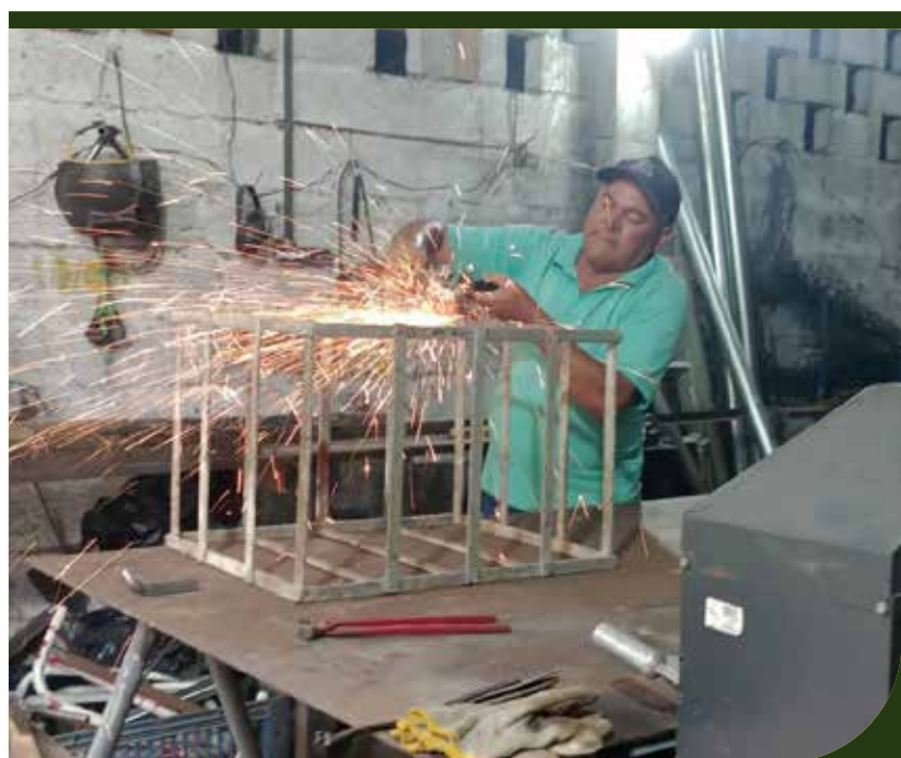
Reparos em grade de proteção para ar-condicionado que será instalado na Policlínica do Rádio Clube