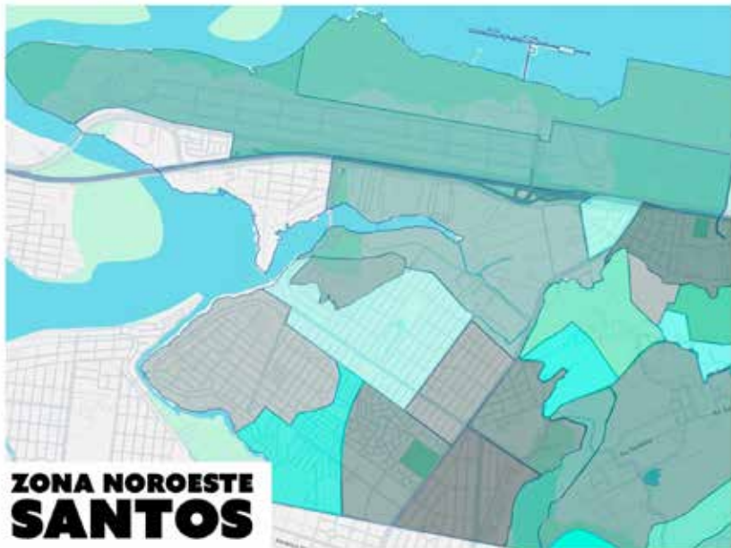
ZONA NOROESTE SANTOS