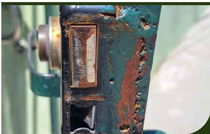
Troca de fechadura na unidade Seacolhe CA, na Rua Júlio de Mesquita, 78.