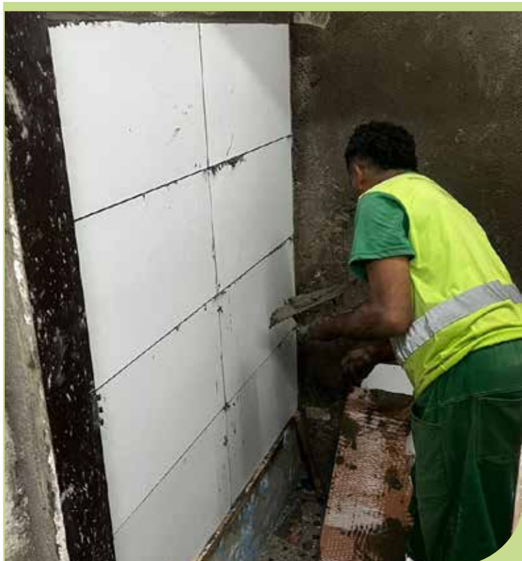
Instalação de revestimento cerâmico no banheiro da Base de Apoio no Monte Cabrão