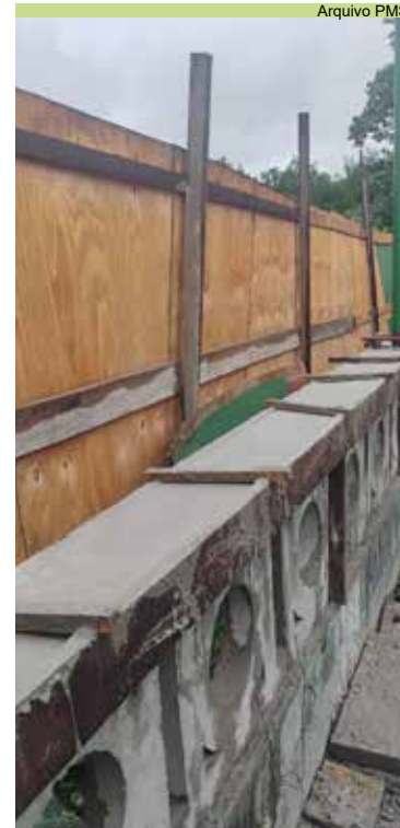
Concretagem de formas na mureta da Coordenadoria Técnica, no Caruara