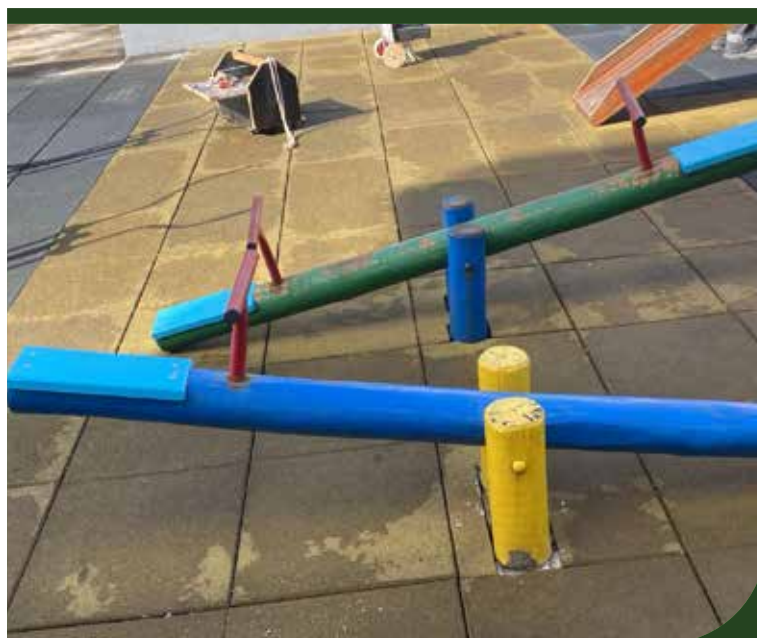
Reparos nos brinquedos do playground da Sociedade de Melhoramentos do Campo Grande, na Teixeira de Freitas