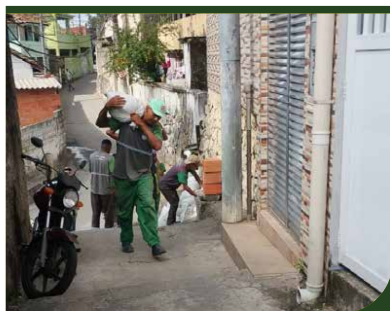
Transporte de material de construção no Morro Penha