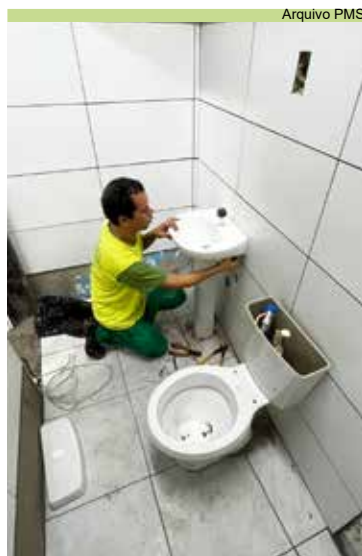
Instalação de vaso e pia no banheiro da base de apoio do Monte Cabrão