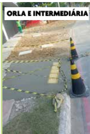
ORLA E INTERMEDIÁRIA

Serviço de limpeza de grelhas no Beco 02, no Vila Progresso