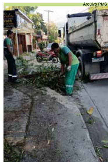
Realização de serviço de cata-treco no bairro Caruara