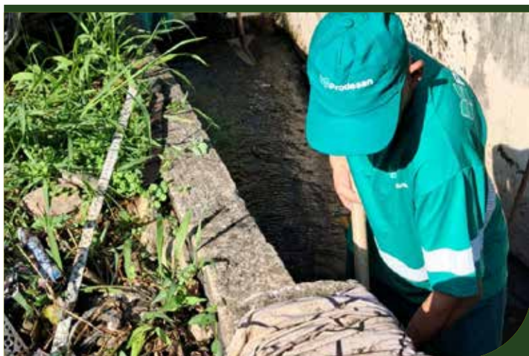
Limpeza de caixa e canal no Complexo Marina Magalhães, no Morro São Bento