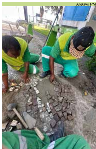
Reparo no piso mosaico na Av. Presidente Wilson número 128, no José Menino