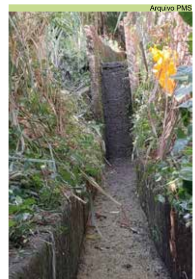
Realização de limpeza de caixas e canal Rua Santa Marta