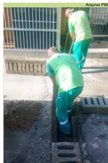
Limpeza de grelhas na Vila Merengue, na Vila Progresso