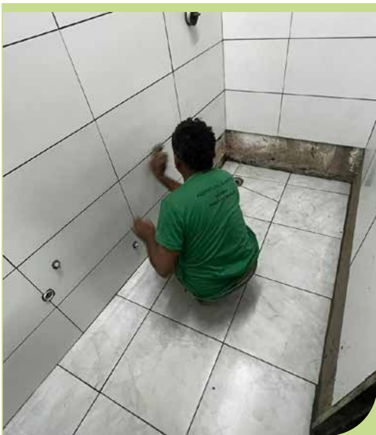
Instalação de revestimento cerâmico e de piso no banheiro da base de apoio do Monte Cabrão