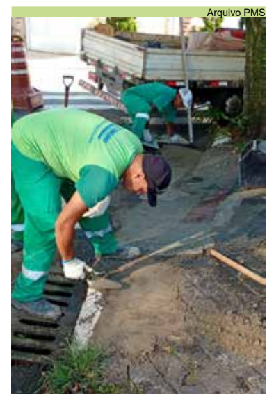
Reparo em rampa de acessibilidade: ruas Nabuco de Araújo e Barão de Cotegipe