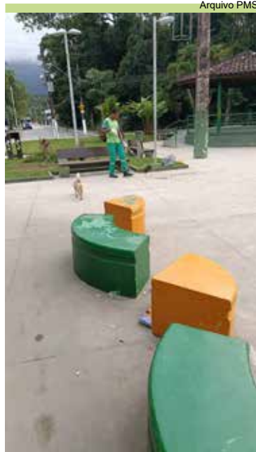
Limpeza da Praça Encarnación Alves Corpas, no Caruara