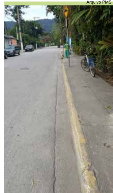
Serviço de limpeza na Rua Andrade Soares, no Caruara