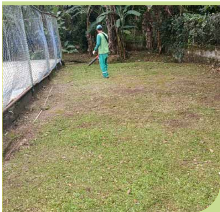
Serviço de roçada na Escola em Período Integral, no Caruara