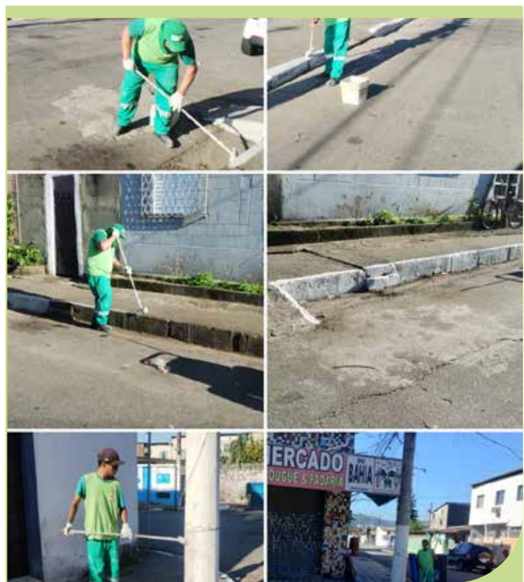
Serviço de pintura de guias e postes na Avenida Brigadeiro Faria Lima