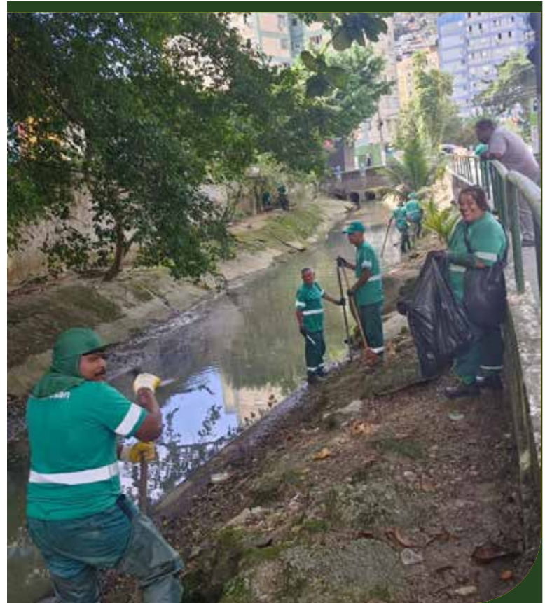
Limpeza manual e capinação no talude do canal Maria Mercedes Féa