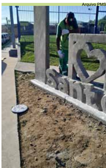
Preparação para pintura do Totem, na Comunidade 52, no Caminho São José

A Prefeitura Regional da Zona Noroeste é uma área administrativa constituída pelos bairro da Alemoa, Areia Branca, Bom Retiro, Caneleira, Castelo, Chico de Paula, Ilhéu Alto, Piratininga, Porto Alemoa, Porto Saboó, Rádio Clube, Saboó, Santa Maria, São Jorge, São Manoel e Vila Haddad.