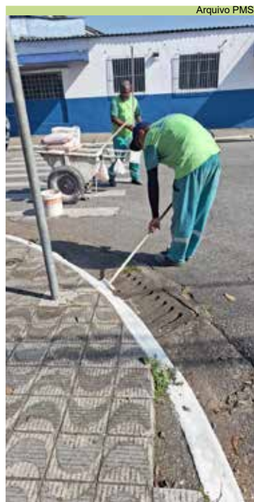
Pintura de guias e postes na Praça Tennyson de Oliveira Ribeiro, na Areia Branca