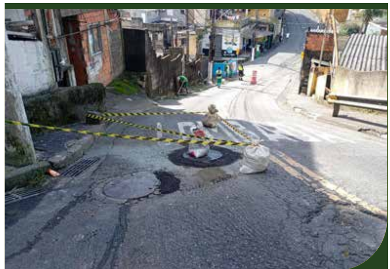
Retirada de pedaço de tubo na calçada da Praça Guadalajara