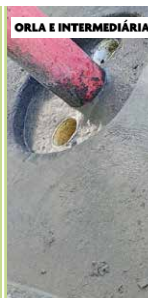
ORLA E INTERMEDIÁRIA

Limpeza do canal da Avenida Brasil, no Nova Cintra