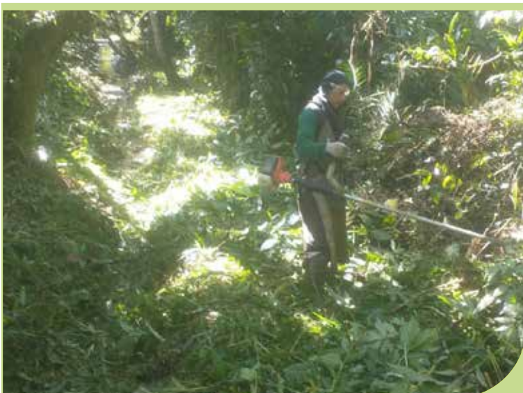
Roçada e limpeza do valão entre o restaurante Dalmo e a Rua Tupi, no Caruara