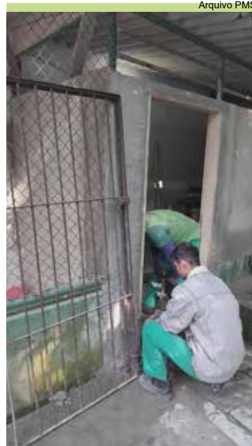
Colocação de grade na base de apoio do Monte Cabrão