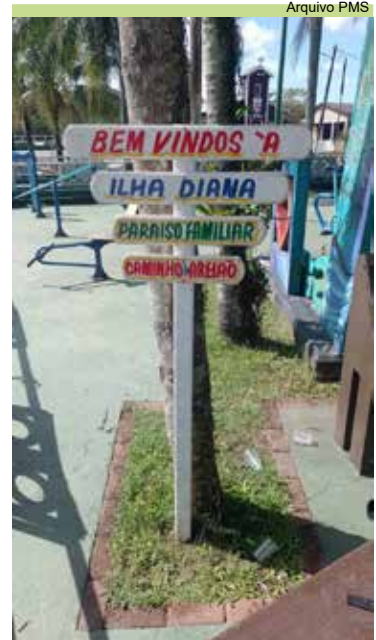
Instalação de placas na praça da Ilha Diana