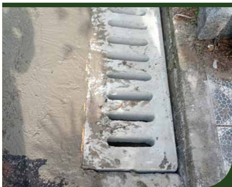
Nivelamento e troca de grelha na Rua das Orquídeas, próximo ao número 357, no Morro Nova Cintra