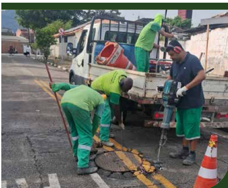
Substituição de poço de visita na Praça Augusto Cerqueira, em frente ao número 12, no Castelo