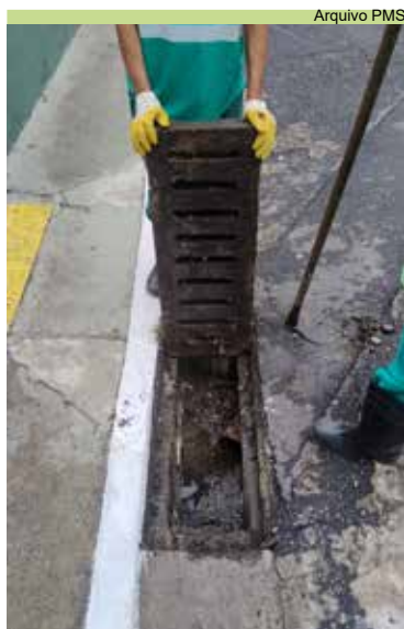
Limpeza de grelha na Rua 5, no Morro Pacheco