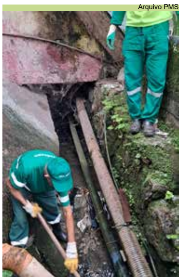
Serviço de limpeza de vala na Rua 4, no Morro Pacheco