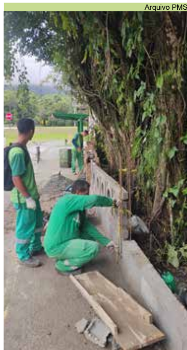
Colocação de formas para a concretagem da mureta na entrada do Caruara