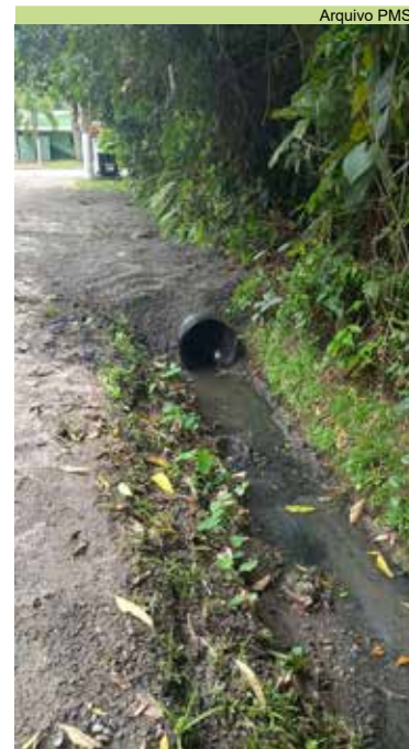
Instalação de tubulação na Rua Caramuru, no bairro Caruara