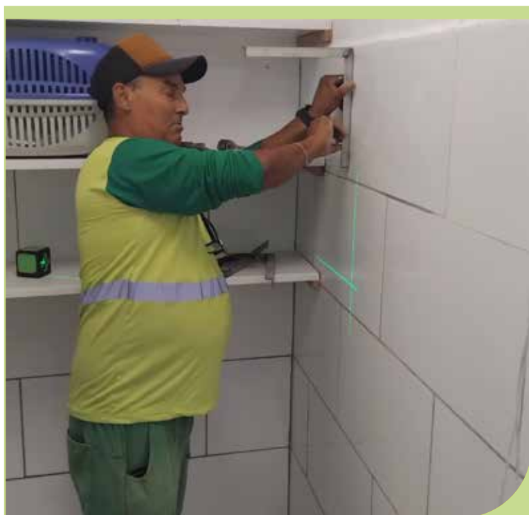
Instalação de prateleiras no depósito da Clínica Veterinária, no Monte Cabrão