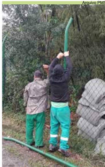
Realizada fixação de tela do alambrado da Prefeitura Regional