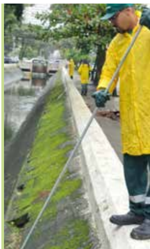
ORLA E INTERMEDIÁRIA

Lagoa da Saudade, no Nova Cintra, recebeu ações de limpeza