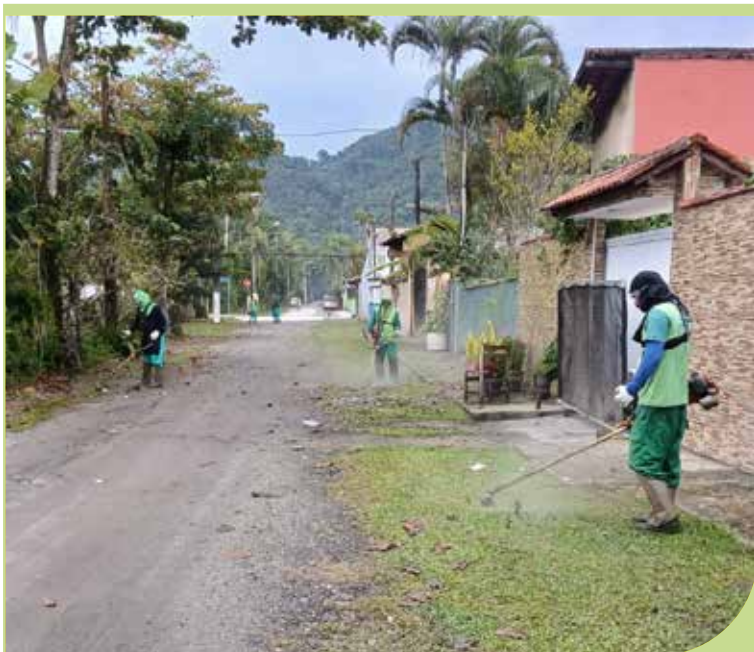
Serviço de roçada avançou por diversas vias da Área Continental