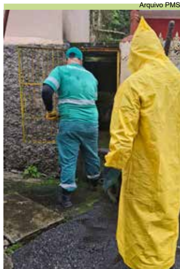
Limpeza de drenagem na caixa de Sopé da Rua Vila Carla, Jabaquara