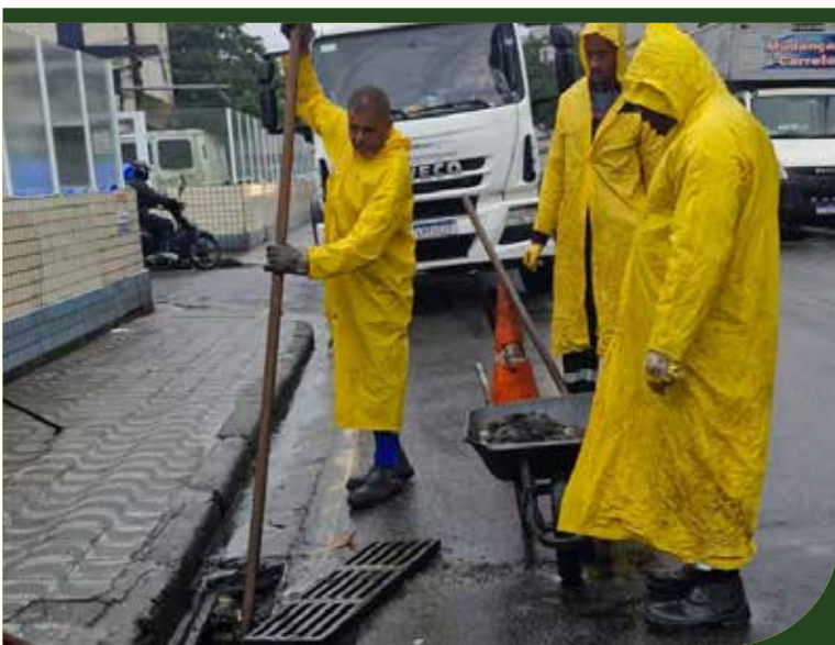
Intervenção no sistema de drenagem da Rua Jurubatuba na Aparecida