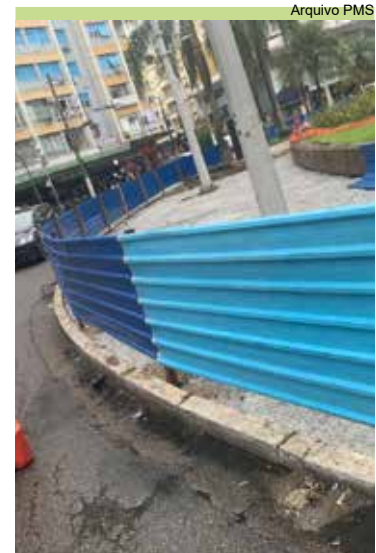
Reinstalados tapumes vandalizados da Praça da Independência